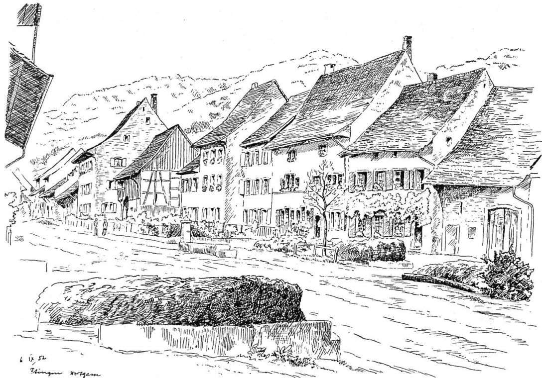
Häuserzeile in Itingen Zeichnung von C. A. Müller

ringe blieben.» Gleiches Recht wurde auch der Stadt Basel in Betreff der ihr zugehörenden Leute zugesprochen.