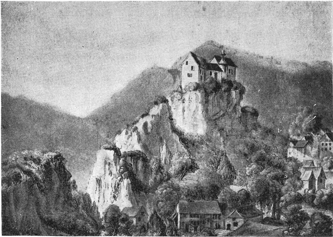
Schloß Burg im Leimental