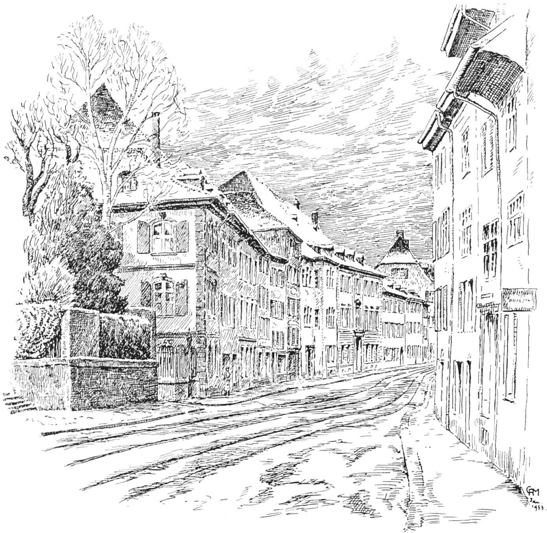
St. Johannsvorstadt Zeichnung von C. A. Müller

Straßenzug, der unbekümmert um die Geometrie nach rechts und links schwingt, mit kleinen Bürgerhäusern, abwechselnd mit Prachtbauten, die an frühere Herrlichkeiten erinnern, nicht Geschäftszentrum, nicht Außenquartier, sondern Verbindung und Uebergang, das ist die St. Johannsvorstadt, wie wir sie kennen.