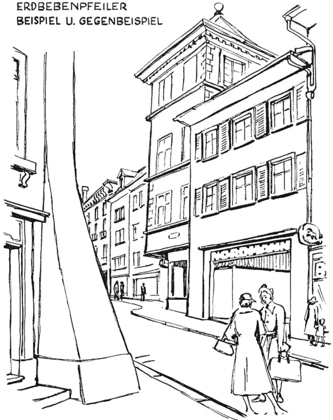
ERDBEBENPFEILER BEISPIEL U. GEGENBEISPIEL

Noch eines: die alte Baukunst hat bei jedem Absatz in der Vertikalen auch einen solchen in der Horizontalen gemacht, also verschieden hohe Bauten oder Bauteile auch im Grundriß gestaffelt. Daher die unerhört lebendige Wirkung eines alten Straßenzuges bei äußerster Sparsamkeit der architektonischen Mittel. Ein überzeugendes Beispiel: der Riedholzplatz. Auch haben die Architekten der alten Zeit nie verschiedene Formen an Fenstern oder Türen durcheinander gewürfelt, sondern sind beim Rundbogen, beim geraden Sturz oder beim Stichbogen geblieben. So stört uns bei Bauten vom Ende des vorigen Jahrhunderts viel weniger die oft etwas schablonenhafte Verwendung von Ornamenten, als die Anhäufung von verschiedenen Formen, die nicht zusammen passen wollen. Wozu aber die überdimensionierten