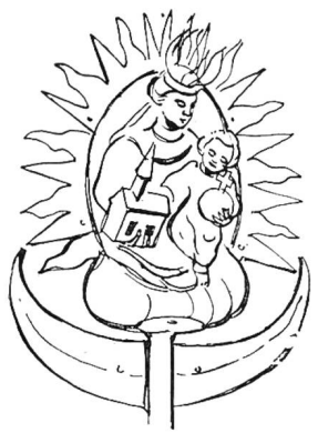
MUTTERGOTTES AUF DEM TURM

dem modernen Stockhammer gearbeitet und nicht mehr mit den alten Steinhauergeräten. Damit mehr Licht von Westen her in die Kapelle gelange, wurde das unschöne Schutzdächlein weggelassen. Eine große Ueberraschung brachte die Untersuchung des Dachstuhls vom Turmhelm. Es zeigte sich, daß er ganz morsch war und daß auch der Helm ursprünglich eine bessere Form besessen hatte. So wurde denn der Dachstuhl gänzlich erneuert und mit Kupfer bedeckt in der ansprechenden alten Form. Durch die Beseitigung eines später eingefügten Ziegeldächleins konnte auch der Anschluß des Helmes an den Turm verbessert werden. Heute steigt der Turm wieder in seiner ursprüng-