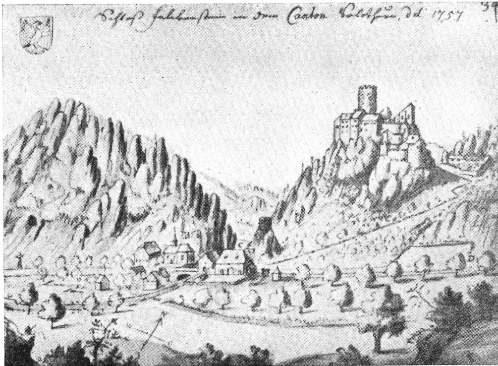
Schloß Neu-Falkenstein mit St. Wolfgang um 1757, nach Emanuel Büchel

sicht. Hinter Aarau fließt die Aare noch eine Meile zur Rechten, ungefähr bis Schönewirth, eine kleine Stunde weit. Nachher dreht man sich mehr links, bis Olten, ein Städtchen 2½ Stunden von Aarau. Hier fahren Sie links an einem kleinen Bergrücken weg. Von dieser höheren Gegend haben Sie eine angenehme Aussicht auf das Thal, in welchem Olten jenseits der Aare zur Rechten liegen bleibt . . . Auf der Höhe von Olten zeigt sich rechts der Arm des Jura-Gebirgs, zu welchem der Hauenstein gehört. Man erkennt sogar die Stelle, wo eine Kluft durch den Felsen gehauen, den engen Paß bildet, der allein in diese Ebene führt.»