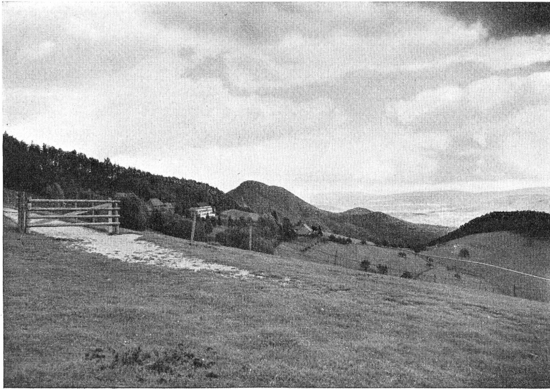
Die Mulde des Allerheiligenberges Blick gegen Osten mit Olten und dem Engelberg