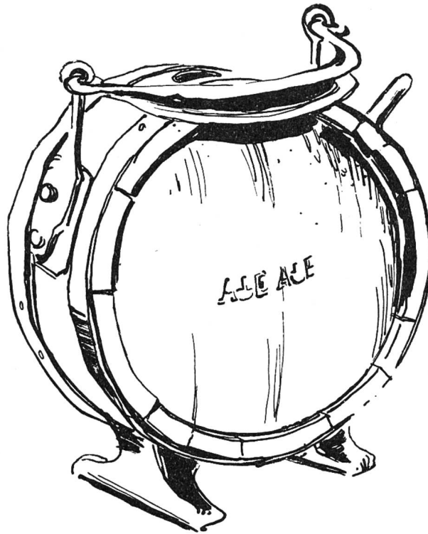
«Lögeli» aus der Sammlung Erzer in Dornach Federzeichnung von G. Loertscher

Schöpfung eines gewandten Küfers handelt. Wohl ist der Küfer aus unsern Dörfern verschwunden, doch hat sich sein Andenken als Dorfname «s Chiefers» erhalten. Der Volkskunstschnitzer war im Schwarzbubenland eine seltene Erscheinung. Von den Kruzifixen und Geigen, die ein gelähmter Bärschwiler im letzten Jahrhundert hergestellt hat, sind leider keine Zeugen mehr vorhanden. Sie wurden schon vor Jahren von Altertumskrämern in die Stadt geschleppt und in klingende Münze umgewandelt.