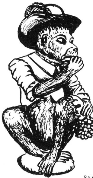
Skulptur auf dem Brunnenstock des Andreasplatzes Zeichnung von P.-H. Boerlin

fahrt, die andere führt in einen zweiten, noch kleineren Platz. In der Mitte des Andreasplatzes stehen eine Linde und ein Brunnen, und auf dem Brunnenstock sitzt ein steinerner Affe, der an einer Traube nascht. Unter der Linde wird auf hochräderigen Handkarren Kleinvieh feilgehalten, Hühner, Gänse, Kaninchen. Schöne Handwerkerhäuser umgeben den Platz und schließen ihn vom Lärm und Verkehr des nahen Stadtzentrums völlig ab. Wir betreten eines der Häuser; eine übersteile Treppe führt in die Werkstatt eines Drechslers. Das Haus ist gänzlich baufällig; das jahrzehntelange Sausen der Maschine hat die Mauern mürbe gemacht. Die schmale, tiefe Liegenschaft gestattet nur wenige Fenster; Treppen und Küche sind ohne Lüftung. Selbst der tapferste Verteidiger der Altstadt wird sich mit dem Verlust dieses Platzes abfinden müssen.