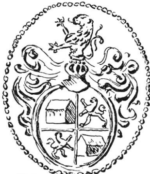
Joh. Christ. Haus 1693