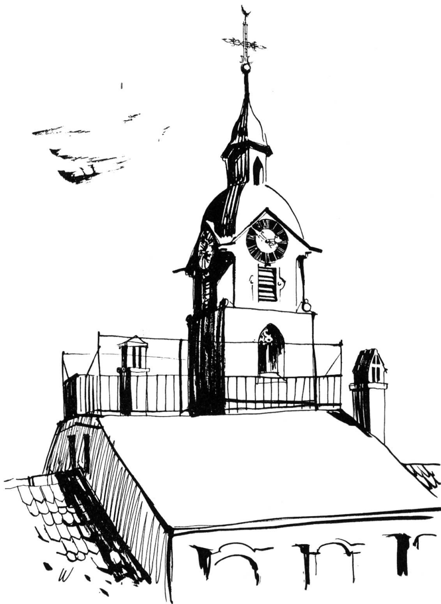
Der Alte Turm von Westen