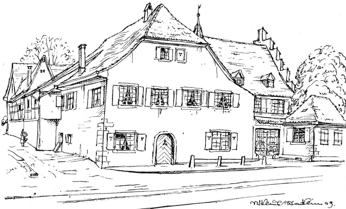
Die Wettstein-Häuser in Riehen Zeichnung von Niklaus Stoecklin

daß in den 1690er Jahren, als sich nach den Wirren des Dreißigjährigen Krieges viele Flüchtlinge in Riehen angesiedelt hatten, die Kirche um einen Drittel erweitert worden ist. Nun stellte man Grabungen an und stieß auf die Grundmauern der ältern, gleich langen, aber eben schmälern Kirche, die aus der spätgotischen Zeit stammt. Nicht genug damit. Man konnte noch den Grundriß eines merovingischen Gotteshauses finden. Und dieser Kirche ist schließlich noch eine weitere, allerälteste Anlage vorausgegangen, wie die entdeckten Plattengräber und die Tonfunde bezeugten.