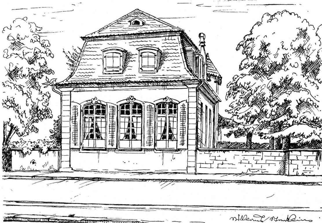
Cagliostro-Haus des Glöglhofes in Riehen Zeichnung von Niklaus Stoecklin

Da sind unsere Kirschbäume dabei, die jeden Frühsommer die ersten Früchte in der Schweiz liefern. Damals, in der «guten alten Zeit», war Riehen ein reines Bauerndorf; noch keine 1500 Einwohner zählte es vor hundert Jahren, heute sind es 10000. Es ist in den letzten Jahrzehnten zu einem städtischen Vorort, genauer gesagt, zu einem blitzsauberen Gartendorf herangewachsen, Gärten, nicht Fabriken, Bäume und Blumen, nicht Kamine und Rauch wurden seine Kennzeichen. Das neueste Riehen nimmt einen andern Charakter an. Hier herrschen die großen Wohnkolonien vor. Die alten Basler, die ja immer besondere Feinschmecker waren, wußten schon längst, wie schön es «auf dem Lande» in Riehen war. So baute eben der eine und andere hier einen Gutshof mit einem Sommerhaus im Bauernstil. Im 18. Jahrhundert erfuhren dann diese Güter eine gründliche Umgestaltung. Haus und Garten wurden nach französischem Muster umgebaut. Aus den einst bescheidenen Sommerhäusern entstanden Herrrensitze, umgeben von prächtigen Parkanlagen, und die ehemaligen Weideplätze wurden zu Gartenanlagen umgewandelt, die mit ihrem herrlichen Baumbestand noch heute die Zierde des Dorfes bilden.