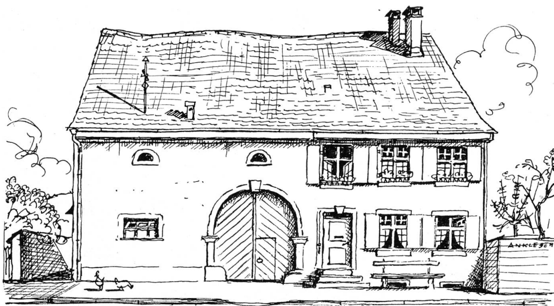
Bauernhaus des Glöglihofes in Riehen Zeichnung von Niklaus Stoecklin

aber mehr erfordert, so hab ich den Befehl gehabt, zu holen, welches auch geschähen». Der alte Weibel wird geschmunzelt haben, als er diesen Satz niederschrieb. Die Riehener sind zu jener Zeit mit dem Trinken nicht zu kurz gekommen, denn ihr Dorf saß ja mitten in den Reben. Heute ist es nur noch ein kleines Stücklein im «Schlipf», dem Abhang des Tüllinger Hügels. Aber dorthin getraut sich kein Schweizer von jenseits des Rheins, denn sie glauben, man sei dort bereits im Deutschen, dieweil doch der Rebhang noch gut eidgenössischer Boden ist.