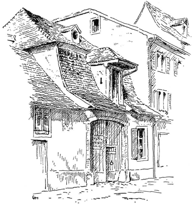
An der Utengasse

So war ein jeder Hausbewohner froh, wenn auf dem Dache seines Hauses ein Aufbau zwischen den übrigen Dachluken vorhanden war, der für den Aufzug der Waren, des Brennholzes oder gar der Möbel dienen konnte. Die Trauflinie wurde durch eine solche Vorrichtung meist in der Mitte jedes Hauses durchbrochen; eine türartige Öffnung, über der an einem vorstehenden Balken eine Rolle zum Aufziehen sichtbar war, fand sich früher an den meisten Bürgerhäusern unserer Stadt. Ganze Gassenzüge wiesen Haus um Haus einen solchen Dachvorbau auf; man braucht da nur einmal Merians großen Stadtplan von 1615 zu Rate ziehen.