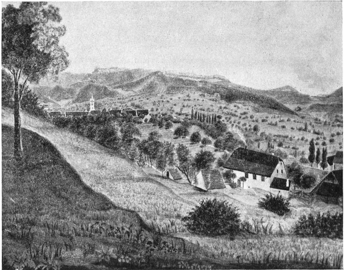
Rohr und Breitenbach um die Mitte des 19. Jahrhunderts. Nach einem Aquarell von Propst P. Carl Motschi.

gefragt, welche Stellung sie zum neuen Glauben einnahmen. Breitenbach gab im November 1529 folgende Antwort: «Haben sich entschlossen, bei dem Mandat zu bleiben, der Priester gefalle ihnen wohl, predige recht und friedlich und halte Messe dazu». Anno 1530 antwortete die Pfarrei Rohr: «Danken zum höchsten, dass M. H. H. sie bei dem alten Wesen haben bleiben lassen und wollen bei Messe und Bildern wie von Alters her bleiben.» Im Jahre 1844 wurde im Dorfe eine neue, grosse Kirche gebaut, die alte in Rohr abgebrochen und im Jahr 1923 in der Nähe der Kirche ein hübsches Pfarrhaus gebaut. 1933 sind die alten Kirchenglocken durch drei neue ergänzt worden, sodass Breitenbach jetzt eines der schönsten und imposantesten Kirchengeläute der Talschaft besitzt.