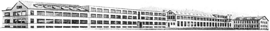
Gesamtansicht der Brac AG. Breitenbach.