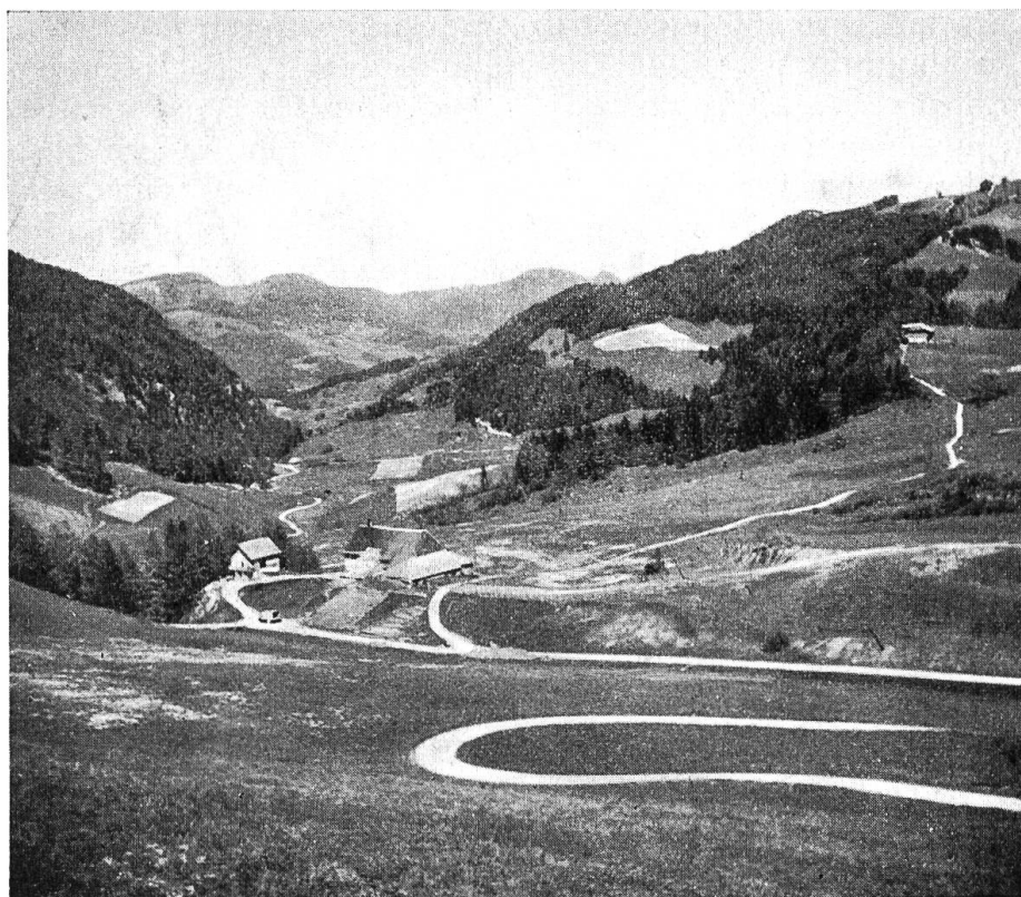
Blick ins Guldental.

wenn sie mehr zu Hause blieben, in der Familie, am Werktag und am Sonntag? Zwar wirst du sagen: Immer gab es Zugvögel, die das unruhige Blut forttrieb, in die Fremde, in den Söldnerdienst, nach Amerika; aber wer ein Heim hatte, ein Stück eigenen Boden, der schmiedete sich sein Glück in den Grenzen der Heimat, in der Werkstatt, suchte den Boden zu bebauen, den sein Vater gerodet. Der Krieg hat unsern Grenzhag geschlossen. Heimat bedeutet mehr als in Zeiten, da das Ausland offene Türen hatte. Darum bedeutet manchem von uns der Ort, wo wir wohnen, heute mehr als gestern.