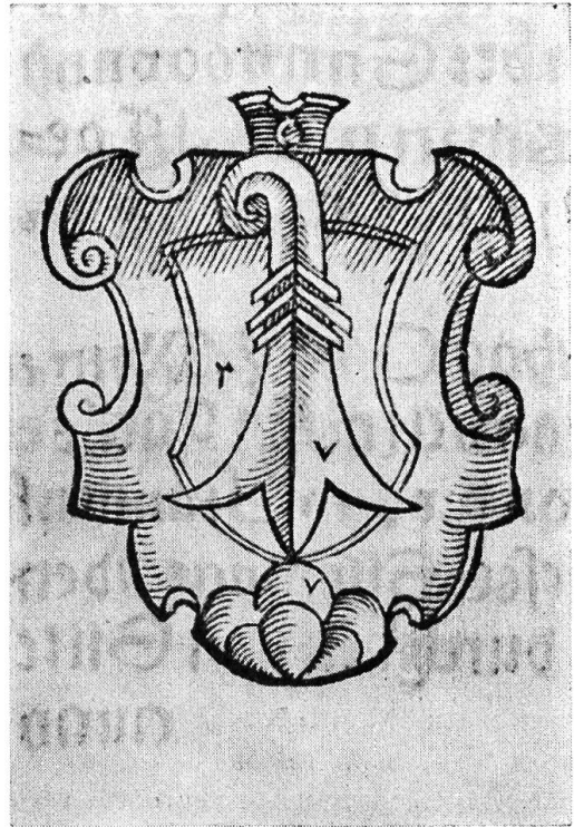
Wappen von Delsberg.

Man kommt über den schönen Bogen der alten Brücke, die das Wappen der Stadt, den weissen Bischofstab im roten Feld, trägt, steigt steil hinan und gelangt durch die Strasse, die das Andenken an den jurassischen Volksführer und Freiheitskämpfer Pierre Péquignat ehrt, zum Rathaus und zum ersten Brunnen. Und es ist eine brunnenreiche Stadt, dieses Delsberg. Sie sind alle im 16. Jahrhundert gemeisselt worden. Da ist zuerst der schöne Marienbrunnen. Er trägt das Wappen des Wiederherstellers des Bistums in der Gegenreformation, Jakob Christoph Blarer von Wartensee. Vor dem Schloss steht der Wildemann-Brunnen, und immer, wenn ich ihn sehe, muss ich an unsern lieben Füsilier Müller denken, der uns einst ganz herzlich versicherte, das Wasser wäre herrlich kühl wie sonst nirgends — nachdem er