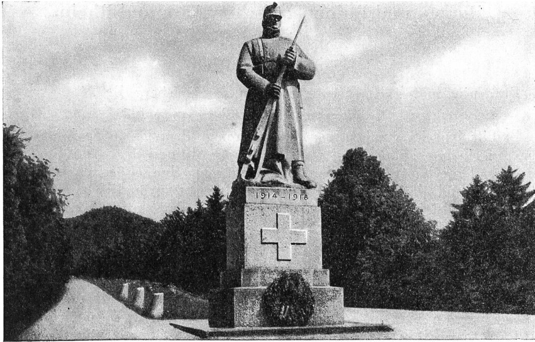
Die Schildwache auf Les Rangiers.

Durch schüttiefen Schnee zog die endlose Marschkolonne schwitzend und pustend der Höhe zu. Auf einmal lief eine Bewegung durch die Truppe. «Der General!» Dort oben, gegenüber dem Wirtshaus von Les Malettes, stand er ganz allein. Kein äusseres Abzeichen hätte seinen Grad erkennen lassen. Unwillkürlich strafften sich die Körper, wurden die Schritte energischer. Wir sahen hinüber und schauten in die ernstesten Augen, deren Blick auf jedem einzelnen von uns zu ruhen schien. In dem grossen, derben Gesicht lagen Kraft und der feste Wille, der diesem Manne nötig und eigen war, seine schwere, verantwortungsvolle Aufgabe zu tragen und zu lösen. «Unser General!» Fast waren wir stolz, fast hatten wir ihn lieb. So ist mit dem Namen von Les Rangiers auch das Gedenken an den Führer der schweizerischen Armee verbunden. Heute gehört der General schon längst zu unsern toten Kameraden.