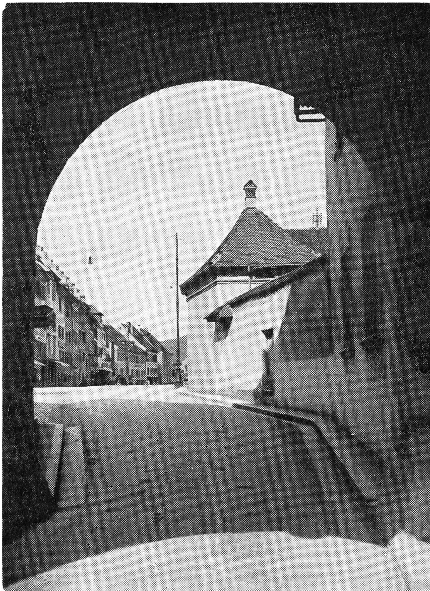
Delsberg, Porte de Porrentruy.

Immer in diesen Tagen des sinkenden Jahres, da aus dem Grün der Wälder das Sonnengold des Herbstes stets sieghafter herausleuchtet, muss ich in den Jura fahren. Ich suche ein Städtchen auf, wandere durch Dörfer und über Weiden und gehe durch das Dunkel der Tannen und das lodernde Feuer der Buchen. Ich wähle wohl den Ausgangspunkt meiner kleinen Reise, aber ihr Ziel lege ich nicht zum vornherein fest. Ich überlasse es gar oft dem Zufall und der Lust der Stunde und — den Erinnerungen. Zwischen dem Rhein und Les Verrières spannt sich ein weiter Bogen, und er schliesst alle meine Erlebnisse in der ersten Grenzbesetzung in sich. Wie oft tönt es mir entgegen: Das war hier! Das war damals! Weissst du noch? Und ob ich es weiss!