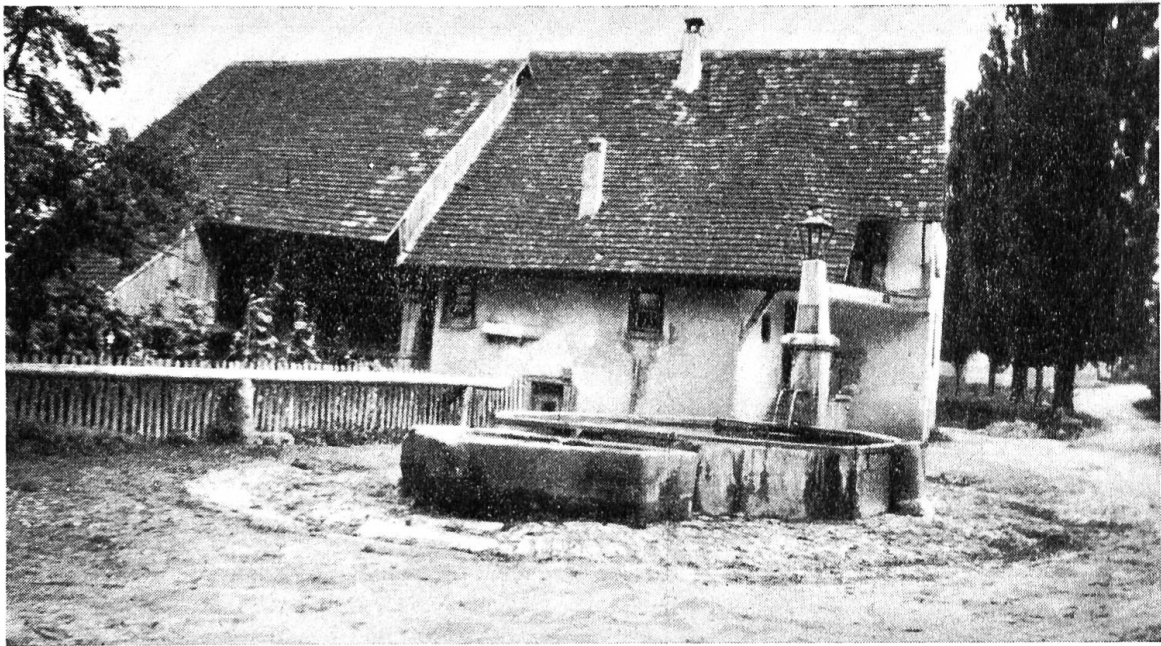
Der hintere Dorfbrunnen von Metzerlen. Solche »Denkmäler« müssen erhalten bleiben!

nicht nur alle das Schwarzbubenland betreffenden Stiche, Bilder und Ansichten gesammelt werden, sondern auch alle Bücher und Schriften, die von unserer Gegend handeln. Diese Bibliothek und eine möglichst vollständige Schwarzbubenland-Bibliographie liessen sich im ehemaligen Glockenhaus unterbringen.