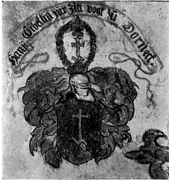
Abb. 10. Wappen des Vogtes Hans Gibelin.

Zu beiden Seiten des Wandbildes links und rechts unten sind die Wappen der Familie angebracht.