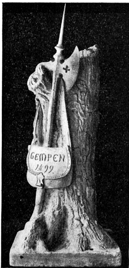
Modell von Joseph Pfluger.

Der künstlerische Entwurf für das auf Veranlassung und auf Kosten des Staates erstellte Denkmal, das einen abgebrochenen Baum mit ausgehauener Waidtasche und angelehnter Halpate darstellt, war eine Schöpfung des solothurnischen Bildhauers Joseph Pfluger . Das von ihm geschaffene Modell ist noch heute vorhanden 9) . Joseph Pfluger (1819—1894), ein Schüler des Zeichnungslehrers Franz Graff in Solothurn und der Akademie der bildenden Künste in München, seit 1858 Lehrer für Zeichnen und Modellieren an der städtischen Handwerkerschule in Solothurn, hat eine Reihe von Bildwerken im Kanton geschaffen. Unter den im Schweiz. Künstler-Lexikon 10) aufgeführten Arbeiten des Künstlers fehlt der Gedenkstein von Gempen.