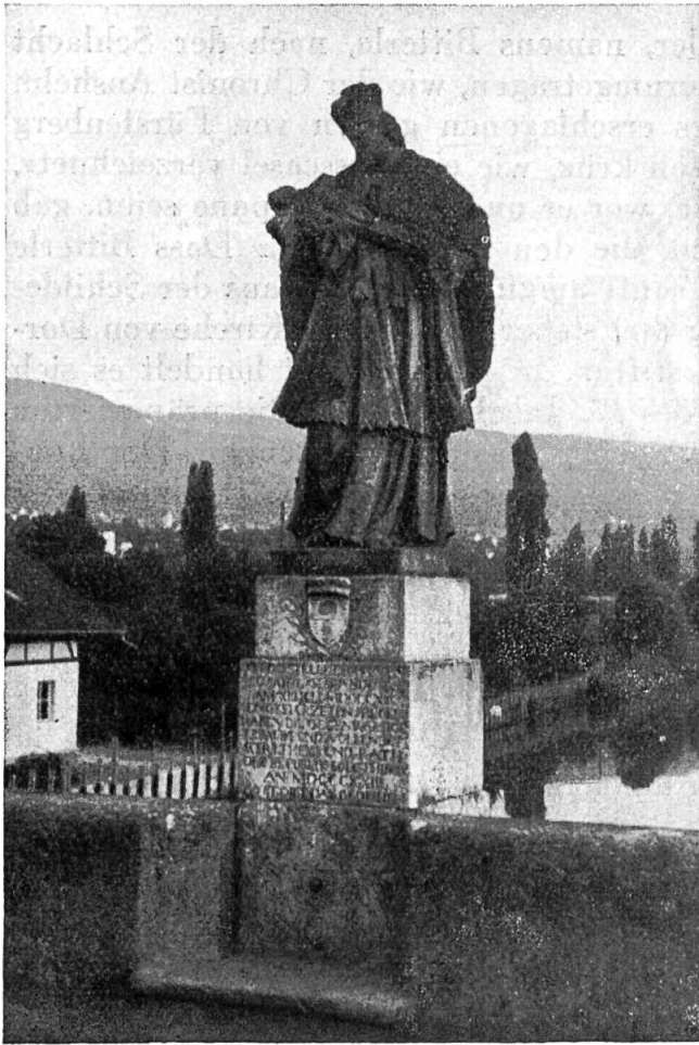
Die Nepomukstatue von Dornach.

Statue auf der Doubsbrücke in Saint-Ursanne zeigt ihn zudem mit fünf Sternen (von denen der eine offenbar abgefallen ist) um seinen Nimbus. Nach der Legende sollen nämlich fünf strahlende Lichter den Ort angezeigt haben, wo sein Leib in der Moldau lag.