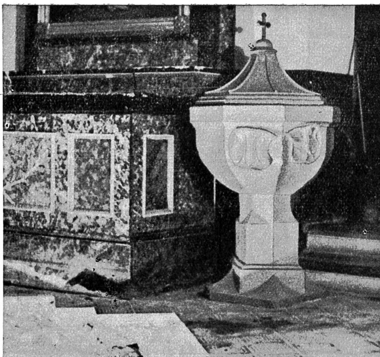
Abb. 2. Taufstein der Kirche in Oberdornach. Mit den Wappen der Familien von Efringen und Salzmann. Um 1470.