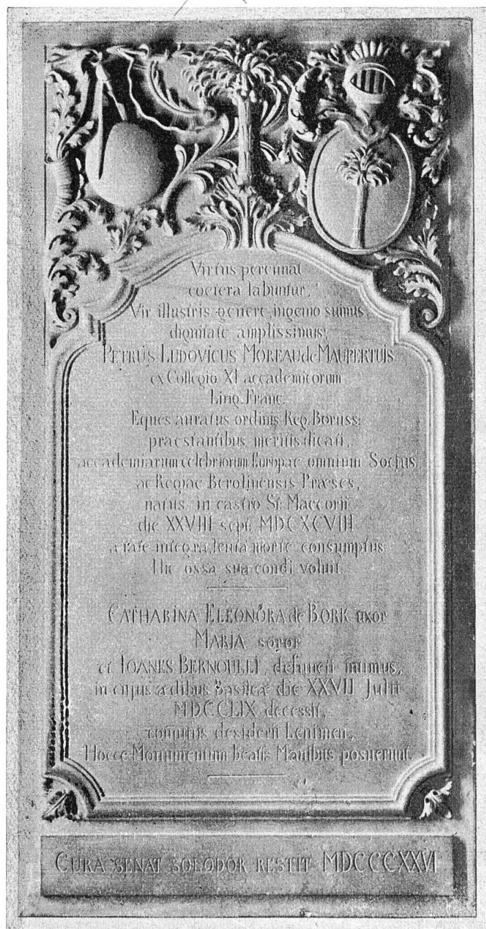
Abb. 1. Epitaph von Maupertuis. Kopie von 1826 nach dem Werke des Jacob Umbher von 1759.

Die Kirchen von Oberdornach und Arlesheim sind schon auf dem Dornacher Schlacht - Holzschnitt dargestellt. Diese Abbildungen gehören also zu den ältesten topographischen Dokumenten, die uns überhaupt erhalten sind. Die Stadtansichten der kurz vorher in Nürnberg erschienenen Schedel'schen Chronik sind noch auffallend schematisch gehalten, während auf dem Schlacht - Holzschnitt die Käsbissentürme der Mauritiuskirche von Dornach und der alten Ottilienkirche von Arlesheim neben dem grünen Berg- hang das Bild beherrschen. Bei Arlesheim lässt sich der Holzschnitt aus dem Jahre 1499 oder 1500 noch genau anhand der Zeichnung kontrollieren, die Büchel 1754 von der alten Kirche festhielt. Die Zeichnung von Büchel zeigt die alte Kirche mit dem neuen Dom auf einem Blatt. Neben dem über- ragenden Neubau nimmt sich die schlichte Landkir- che sehr bescheiden aus, und man wird daher begrei- fen, dass sie allmählich zer- fiel und schliesslich abge- rissen wurde. Aber die Kir- che von Dornach steht noch heute und soll nun als Hei-