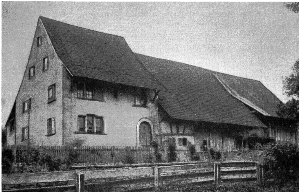
Das Schnidersche Haus in Benken um 1900.