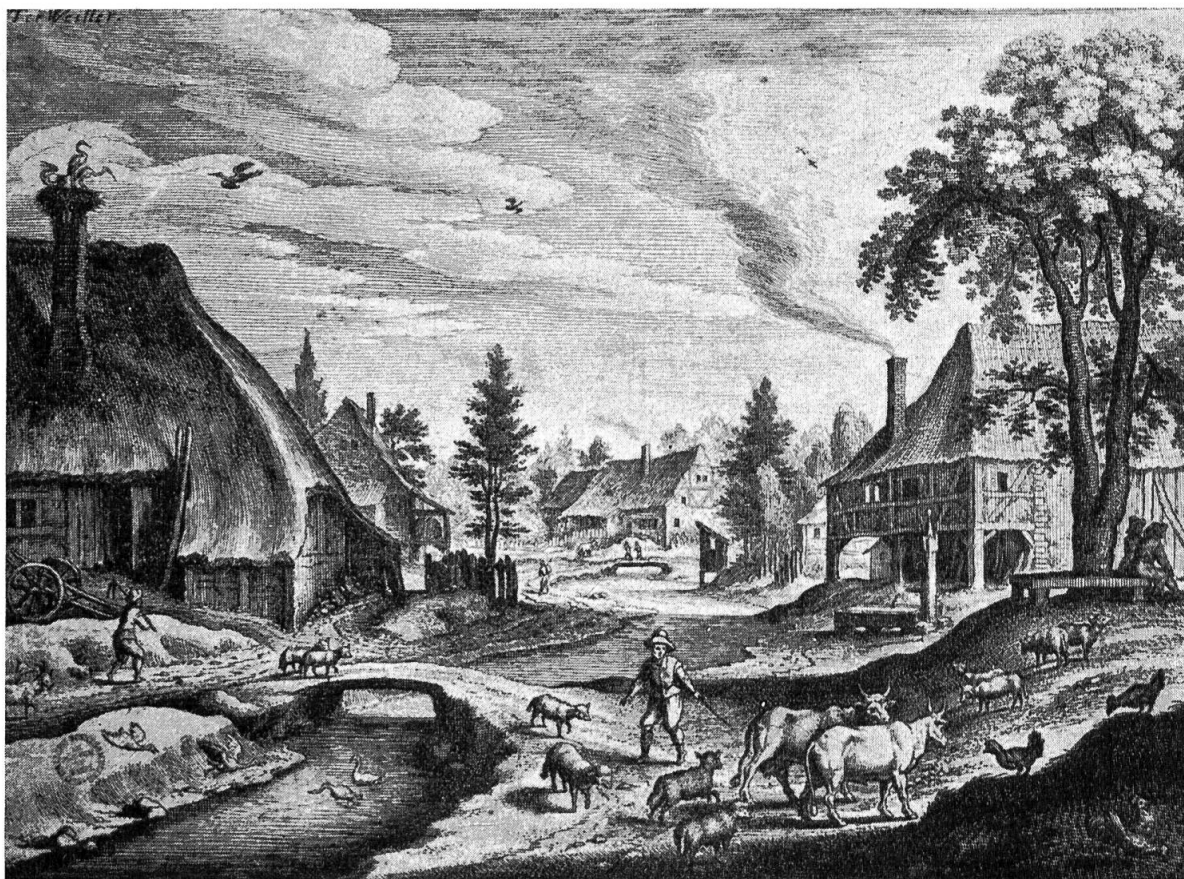
Therwil um die Mitte des 17. Jahrhunderts.

Nach einem Kupferstich von Matthäus Merian d. Ae.