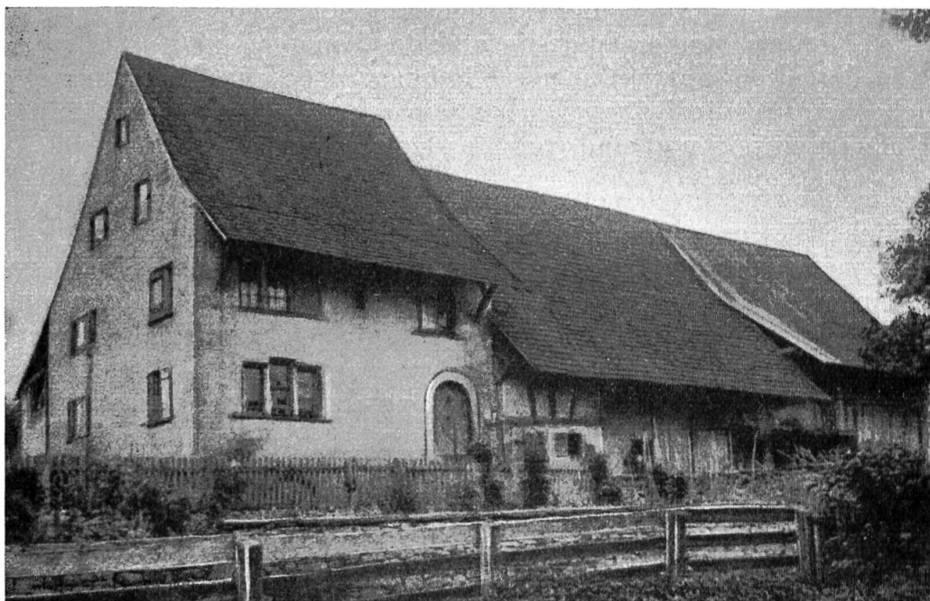
Das Schnidersche Haus in Benken um 1900.