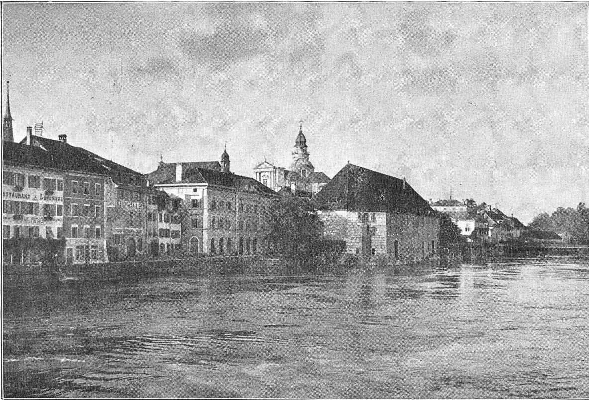
Solothurn. Blick auf das Landhaus und Sankt Ursen.