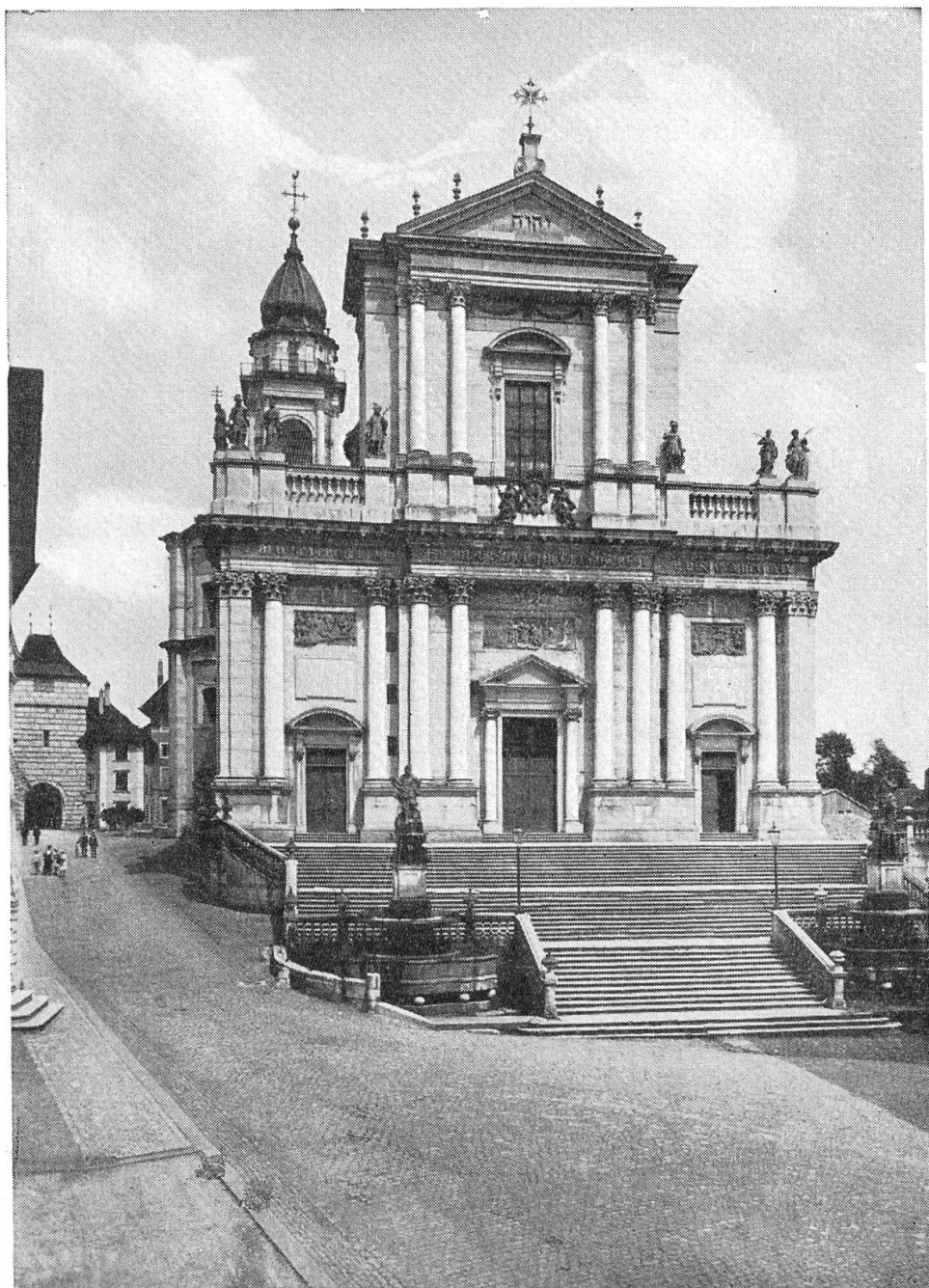
Solothurn. Sankt Ursen.

staut wurden. Vorbei die alte Herrlichkeit! Napoleon schrieb der Schweiz die neue Verfassung vor. Unser Vaterland wurde sozusagen zu einem Protektorat. Aber als der Uebermut des Europasiegers sich rächte, als die letzte Völkerschlacht verloren, da schien auch unsern gnädigen Herren noch einmal die gute Zeit zu blühen; doch nicht für lange; sie brachte wenig Frucht, und der harsche Wind der dreissiger Jahre fegte die dürrn Aeste alter Herrlichkeit hinweg. Eine neue Zeit begann, die Zeit, da das Volk seine Stimme, sein Recht, seine Befreiung vom Drucke der alten Vorrechte empfing. Hier, beim Franziskanertor, hat der Volksfreund Josef Munzinger, der spätere Bundesrat, das sogenannte Oltnerloch in die Ringmauer geschlagen, das sollte heissen: Volk, ströme durch das Tor herein, dein Platz ist frei!