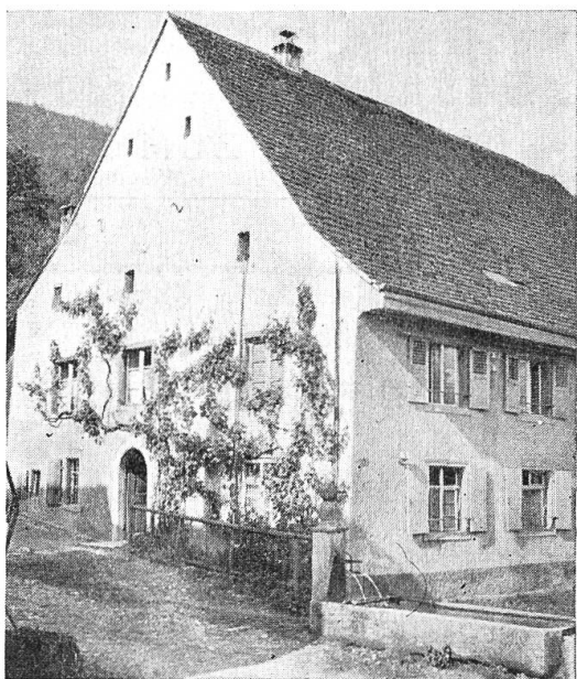
Haus Nr. 52 in Witterswil.

Mauerwerk, etwa ein Dutzend nur aus Fachwerk und die übrigen aus Mauer- und Riegelwerk. Die Einflüsse, welche auf den Hausbau bestimmend einwirkten, kamen aus dem Sundgau, dem Basbiet, der nahen Stadt und wohl auch aus dem welschen Jura.