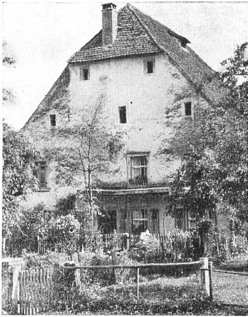
Das Gihrenhaus in Witterswil.

Ein grosser Teil des häuslichen Lebens spielte sich früher und vielerorts noch heute in der Küche ab, die man durch häufiges Weisseln, das meist am Karfreitag besorgt wurde, heller zu machen suchte. Kunstherde waren noch zu Beginn des letzten Jahrhunderts selten. Unter dem weiten Kaminschoss wurden Pfannen und Häfen über das offene Feuer gestellt oder an eine Kette gehängt. Das Kamin, sofern ein solches überhaupt vorhanden war, führte oft nur bis auf den Estrichboden, von wo der Rauch seinen Weg durch die Dachlücken suchte. Daher rührt in vielen alten Häusern das geschwärzte, vom Rauch imprägnierte Dachgebälk, von dem man oft annimmt, es deute auf einen einstigen Brand hin. In grossen Bauernhäusern liegen meist zwei oder gar drei Dachböden übereinander. Sie