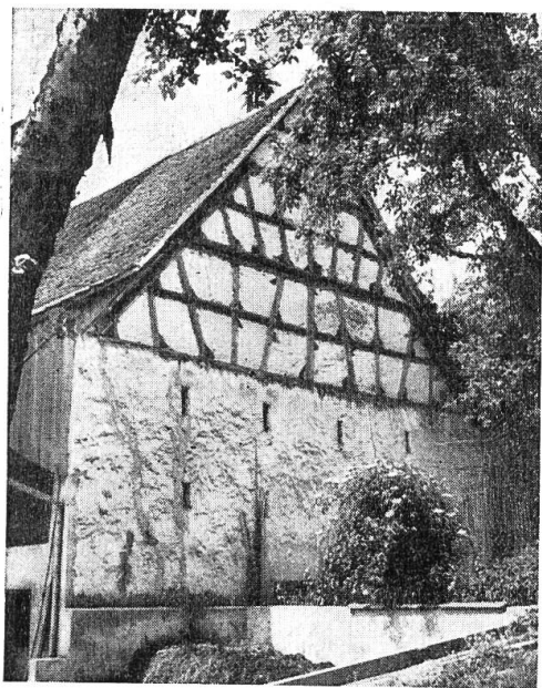
Riegelbau in Witterswil.

Mannigfaltig wie die Landschaft des Leimentals ist auch das Leimentaler Bauernhaus. Im Gegensatz zu vielen andern Gegenden, wo ein Haus dem andern gleicht, kann nicht von einem einheitlichen Typ des Leimentaler Hauses gesprochen werden. Die geographische Lage, die Nähe der politischen und sprachlichen Grenzen, die territoriale Zerrissenheit, die früher noch grösser war als heute, machten sich im Hausbau nicht weniger bemerkbar als in den sprachlichen Nuancen der einzelnen Dörfer.