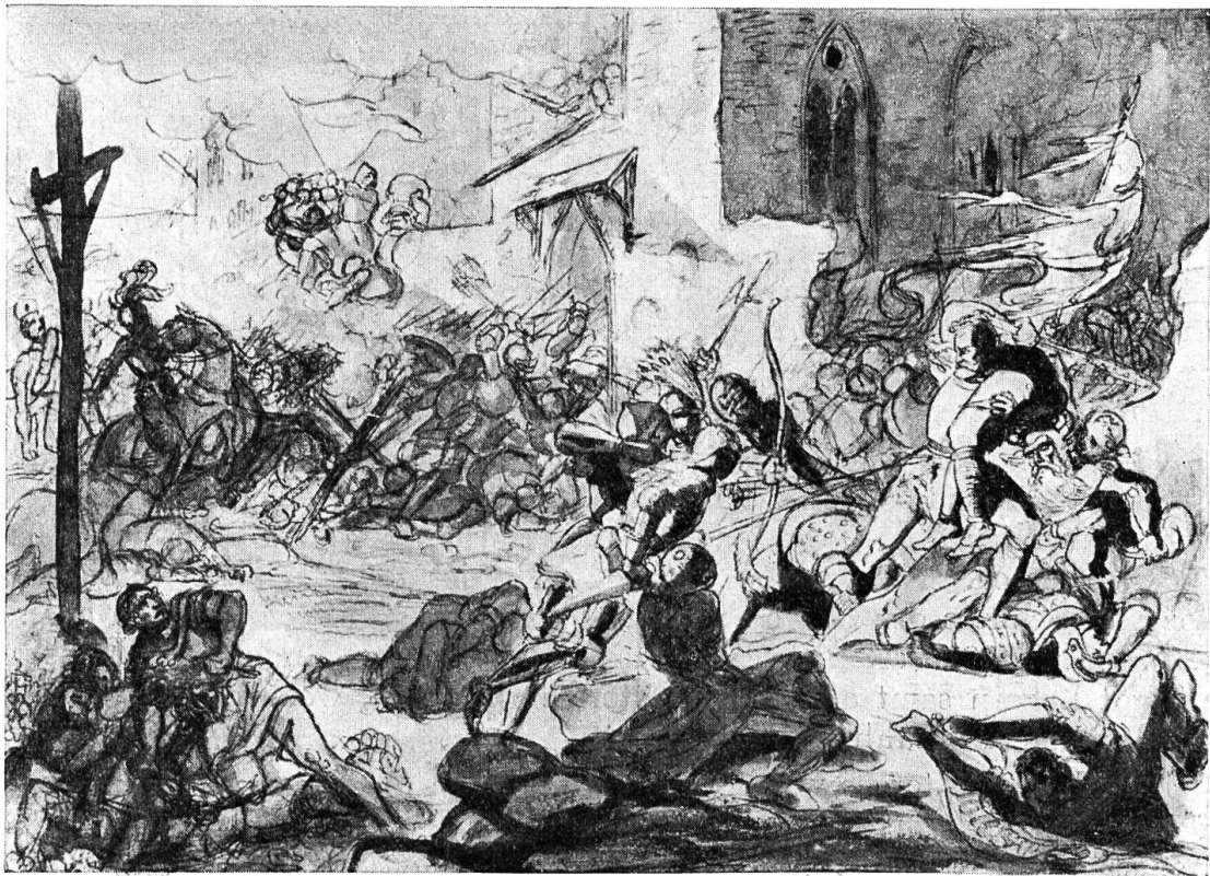
Die Schlacht bei St. Jakob an der Birs.

wieder auf. Es war eine traurige Heimkehr, auch wenn die Gebäude nicht abgebrannt waren. Aber da stunden die Ställe leer, Keller und Vorratskammern waren ausgeräumt, Truhen und Kästen erbrochen, alles verwüstet! Der schöne Traubenertrag dieses Jahres musste grösstenteils an den Stöcken verderben, weil keine ganzen Fässer mehr vorhanden waren. Noch jahrelang machte allerlei Raubgesindel die Gegend unsicher, Leute, die in der Schule des Krieges Rauben, Brennen und Morden gelernt, die ehrliche Arbeit aber verlernt hatten.