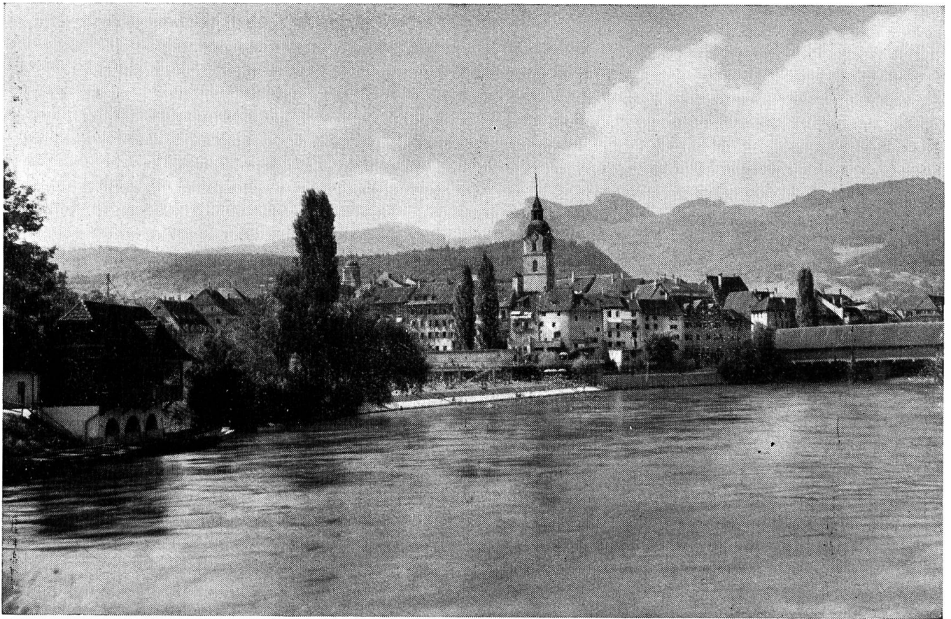
Olten, Blick gegen den Jura.

für den «nambhaften Teil, der allenfalls dem Bistum Konstanz durch die Verlegung des Stiftes entzogen wurde», vom Bischof von Basel eine anderweitige Satisfaktion, also eine Geldentschädigung oder Aequivalenz, und behielt sich im andern Falle seine bischöflichen Rechte vor, was wiederum Unterhandlungen mit Basel notwendig machte. Welchen Erfolg sie hatten, vernehmen wir nicht.