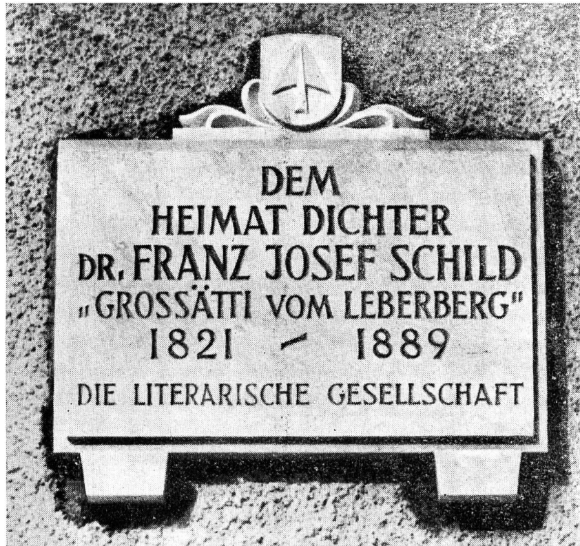
Die neuerrichtete Gedenktafel am Geburtshaus des Grossätti vom Leberberg.

Ha's Chingli uff de-n-Arme gha, Bi sälber Götti gsi, Ha g'spunne, g'wobe Tag und Nacht Und ihm sys Sundigschleidli g'macht: Das aber, das bi-n-i.