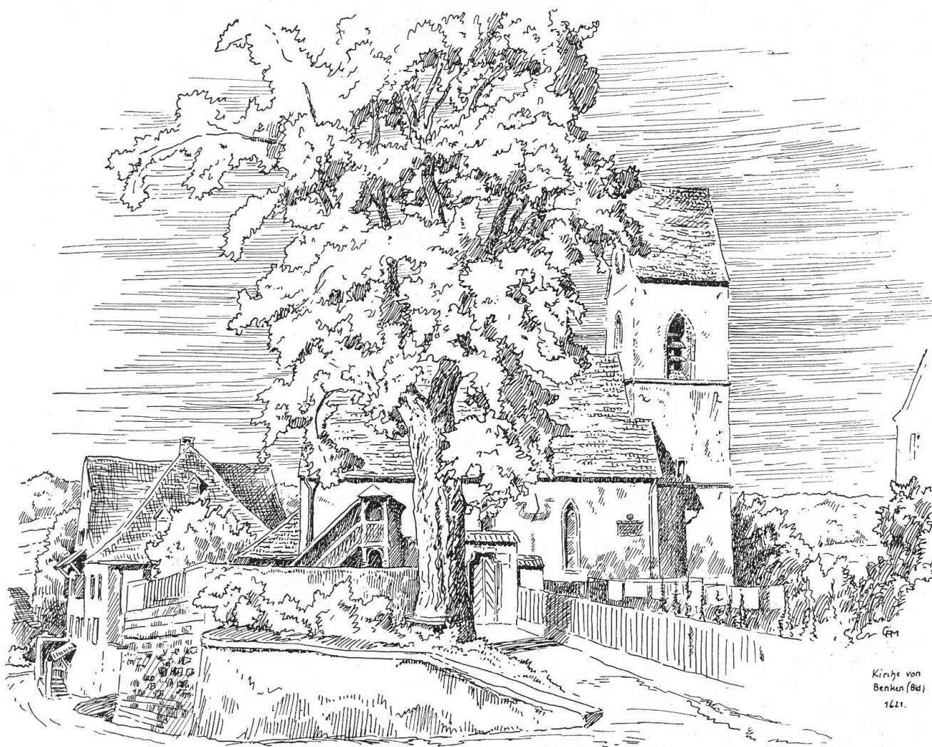
Kirche von Benken (Bas.) 1621.