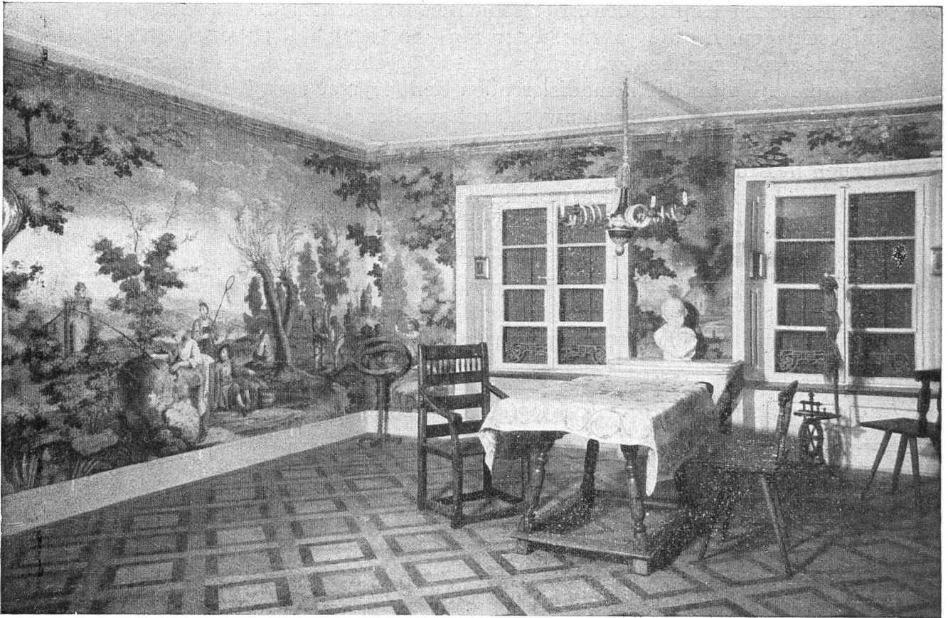
Das Huguenotzimmer im Heimatmuseum Rheinfelden

Zweites Stockwerk: Räume IX—XIV Handwerk, Volkskunde, bäuerliche und bürgerliche Wohnkultur, Kriegswesen und Feuerwehr.