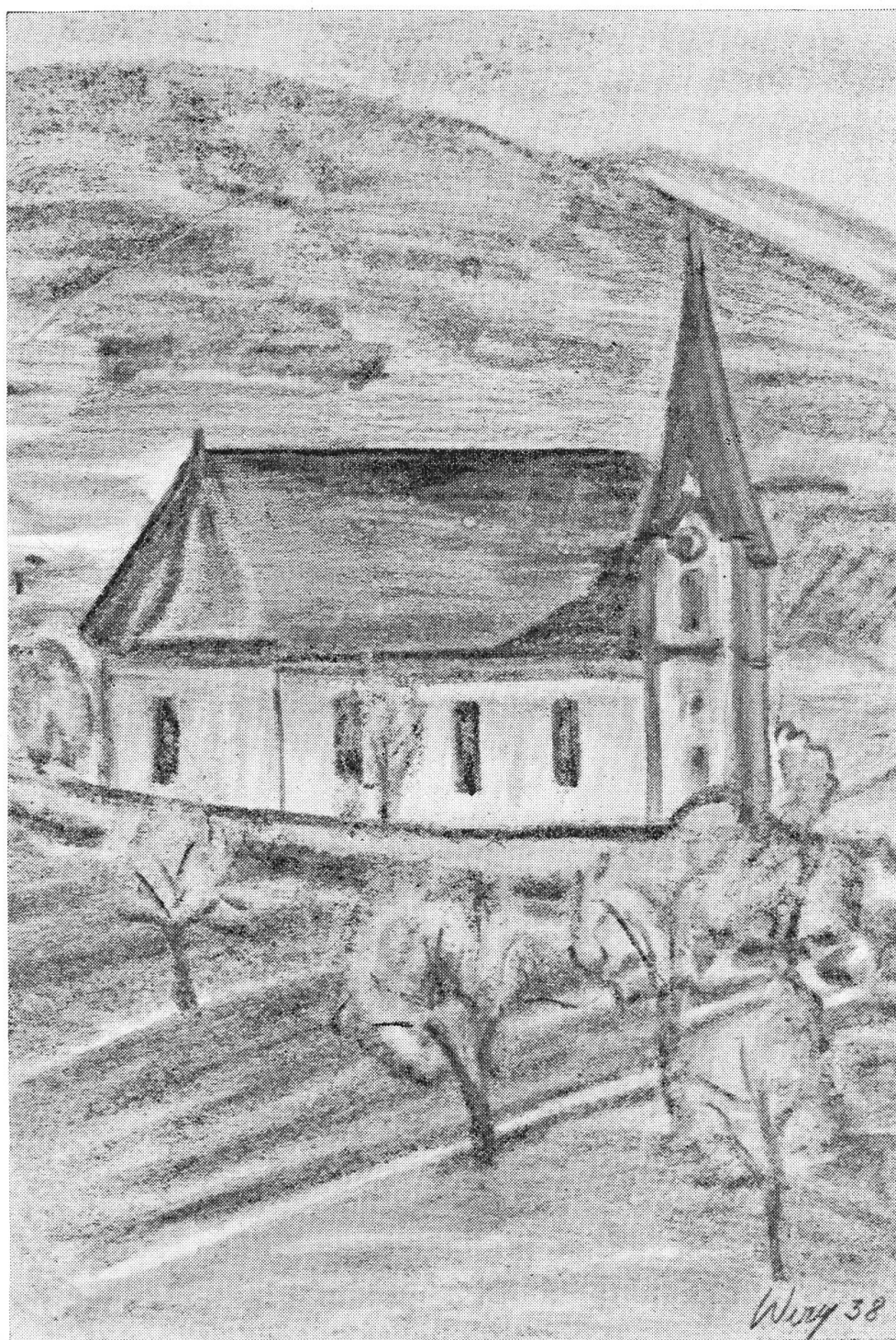
Die St. Germanus-Kirche von Seewen

Im Jahre 1500 wurde das Gotteshaus, das in den «vorgegangenen Kriegen entweicht worden war», von Weihbischof Fillimanus aus Basel neu geweiht. Doch schon im Jahre 1514 erbaute man zu Seewen ein neues Gotteshaus, das aber in späterer Zeit verschiedentlich umgebaut wurde. Sie ist eine der wenigen Kirchen der Umgebung, die zwei Türme besitzt. Vier Glocken