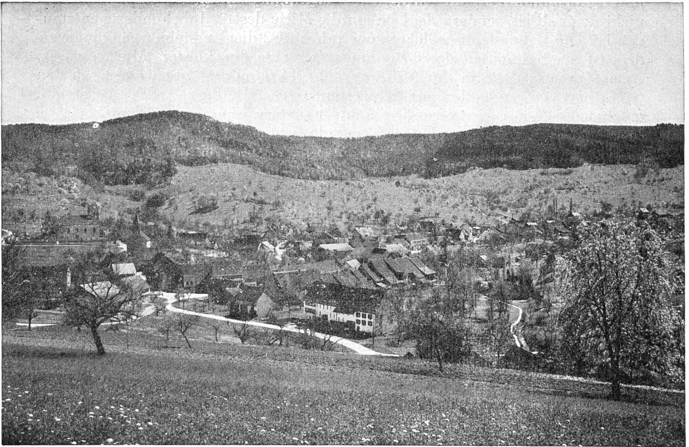
Wegenstetten mit Tiersteinberg