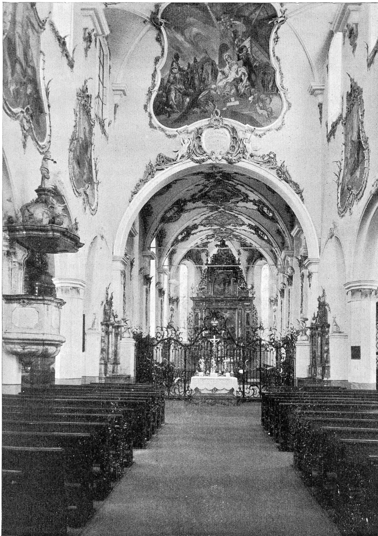
Die St. Martinskirche zu Rheinfelden