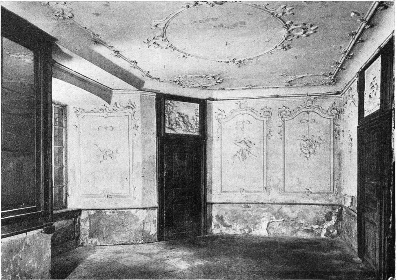
Weiher Schloss Bottmingen. Der Steinsaal im heutigen bedauernswerten Zustand.

geraden Wegen, die oft verblüffende Aspekte gewähren mochten. Dazwischen standen auf Postamenten mächtige Vasen und Sphinxen und in den Ecken der Umfassungsmauern niedliche Pavillons. Denken wir uns dazu noch die friedlich auf dem klaren Wasser kreisenden Schwäne und die fröhlich schäckernde Gesellschaft in weiten Krinolinen, bunten, seidenen Kniehosen und gepuderten Perücken — so mag das Bottminger Schlösschen manchem mit Recht «ein königliches Schloss oder Louvre» en miniature erschienen haben.