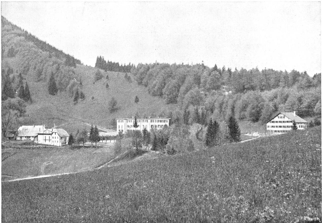
Ober-Balmberg, Kurhaus und Kinderheim.

So steht es in dem Briefe Carl Spittellers. Er war damals, als er mir diese Zeilen schrieb, 77 Jahre alt. Nun ist er schon lange tot; aber wer die Balmberge liebt, der liest gerne heute noch unter einer der weissen Kanzeln im Morgensonnenschein vom «Friedli, dem Kolderi», vom «Olympischen Frühling», oder wenn die Schatten um die Flühe lagern, suchen seine Augen Sonne in den farbigen «Schmetterlingen».