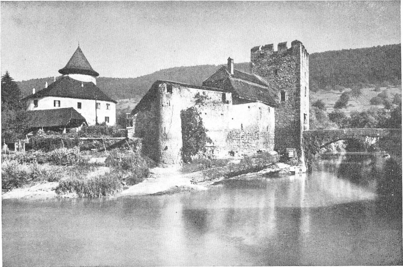
Schloss Zwingen im Birstal.