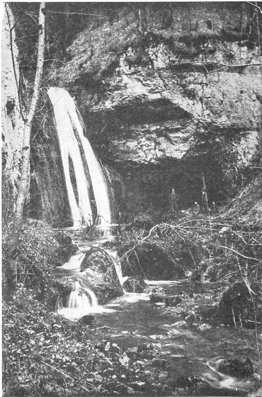
Stritteren-Wasserfall bei Laufen.

kann man es in jedem Tale tun. Eichendorff wäre hier wahrhaftig zu Hause gewesen. Denn das Rauschen der Bäche gehört zu den Steinen und Flügen und Wäldern, nicht umsonst heisst ein Tal das Kaltbrunnental, und wer Einsiedler werden möchte, findet hier hundert Gelegenheiten, eine Hütte zu bauen. Nicht umsonst gibt es im Jura so viele Eremitagen. Sehnsüchtig haben hier Angehörige eines sentimentaleren Jahrhunderts von der Einsamkeit als der einzigen Glückseligkeit geträumt, Nachbilder Petrarcas in Vaucluse. Das Juratal ist wie geschaffen dafür, harmonisch und malerisch sind die Elemente beisammen.