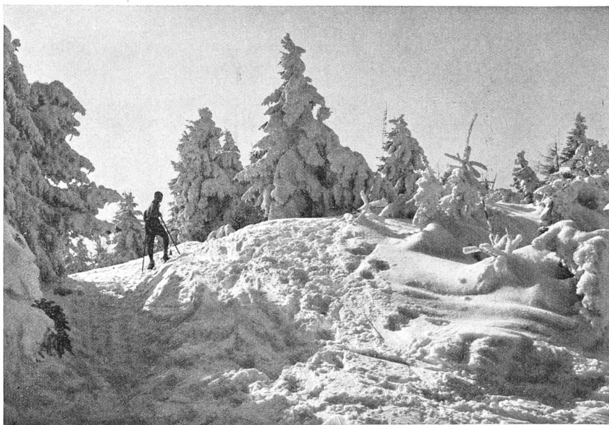
Winter im Jura.

gestählten Skilehrer in die Geheimnisse der Technik dieses schönen Sportes einführen. Und alle diese Leute, ob Skineuling oder Rennkanone, ob Dame mit Skikostüm au dernier cri oder einfacher Bauernbub mit abgetragenen Halbleinhosen, sie alle haben die gleiche Freude: Freude am herrlichen Wetter, Freude an der gesunden Bergluft, am Schnee und den Ski — Freude am Leben! Gewiss haben alle diese Sonntagsfahrer im Alltag ihre Sorgen, doch hier oben treten diese Unannehmlichkeiten zurück, und keine griesgrämigen Gesichter sieht man, ewige Nörgeler; nein, die würden nicht in die herrliche Natur passen! — «Ja», meint ein älterer Herr zu mir, der herauf gekommen ist, um die prachtvolle Rundschau vom Weissenstein aus zu geniessen, «eine glückliche junge Generation heute! Schaut sie an, diese jungen, gesunden Burschen und Mädchen, die sich da mit den Brettern tummeln. Eine Freude ist's, ihnen zuzuschauen. Und gewiss, solange wir eine solche Jugend besitzen, die sich so stählt und stärkt und sich an den Schönheiten unserer kleinen Heimat noch erfreuen kann, da braucht uns nicht bange zu sein um unser Ländchen. Denken wir auch an die prächtigen Finnländer im Norden, die, gesund an Körper und Geist, auf Skiern ihre Freiheit gegen einen an Zahl übermächtigen Feind verteidigen konnten! Es bleibt eben immer noch wahr, was uns das alte Sprichwort lehrt: Mens sana in corpore sano. Ein gesunder Geist in einem gesunden Körper.