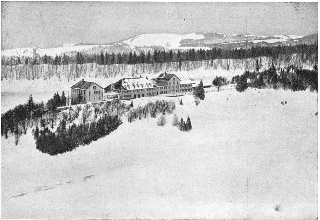
Der Weissenstein im Winter.

Auf der Kurhausmatte des Weissenstein tummeln sich schon viele Ski-begeisterte: Vom kleinsten Knirps, der kaum auf seinen Brettchen stehen kann und diesen auf gut Glück folgen muss, bis zum betagten Herrn, der trotz seiner vielen Jahre noch immer diesen schönsten und gesündesten Sport ausübt. Kreuz und quer fährt alles den Hang hinunter: Die Kanonen mit schmalgeführten Ski und mutig Schwünge ziehend, die steilsten Stellen wählend, während die Anfänger noch unsicher und breitspurig den abgefahrenen Hang traversieren und immer noch dafür besorgt sind, dass ihr Tempo nicht zu rasch wird. Und auf einem abseits gelegenen Plätzchen lassen sich etliche Lernbegierige mit Eifer durch einen jungen, wetter-