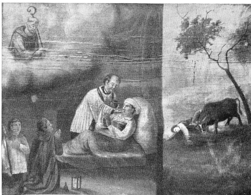
Votivtafel aus der St. Fridolinskapelle bei Breitenbach.

Sehr mannigfach sind die Gaben, die als Opfer und Weihegeschenke dargebracht werden. Wir treffen unbeholfene Gebilde aus Wachs und kunstvoll gezielte, mächtige Wachskerzen (Mariastein), naive Nachbildungen von Tieren und menschlichen Gliedern aus Holz und Eisen (Allerheiligen. Meltingen), Gaben aus Gold und Silber, bes. Herzen (Mariastein), Kleidungsstücke, Krücken, die von Geheilten am Gnadenort zurückgelassen wurden, vor allem aber Votivtafeln, auf welchen der Hergang des erlebten Wunders oft in naiver, drastischer Art dargestellt ist (Mariastein, Meltingen, Oberdorf etc.).