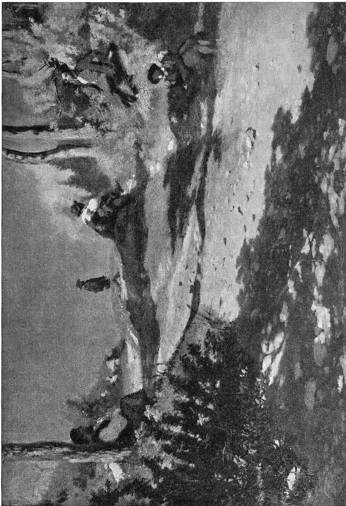
Frank Buchser: Gesellen am Strassenrand.