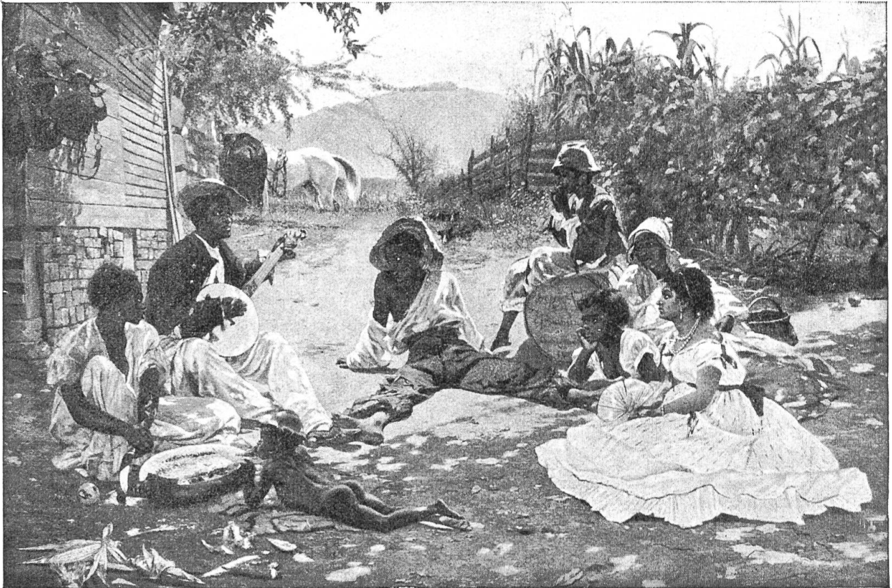
Frank Buchser: Das Lied von Marie Blaine.

äusserst zufrieden. Auch hier begann er jetzt den Realisten der alten Schule nachzueifern, und wenn er im Louvre Gemälde von Rembrandt, Murillo und Tizian kopierte, so war er von Zuschauern förmlich umlagert, so rasch und sicher ging alles vonstatten.