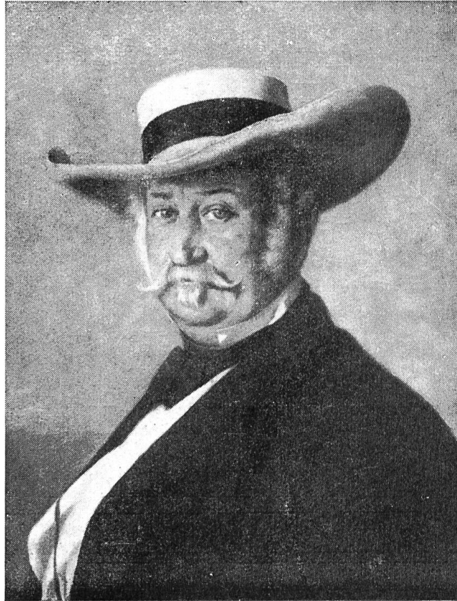
Frank Buchser: General Sutter.

Freunde antraf, setzte auch wieder nach Tanger über und kam 1880, mit Bildern reich beladen, heim. Auf einen Aufenthalt in Rom, Clevano und Carpinete (1881) folgen drei Studienreisen nach Griechenland von 1882—1884, die ihn nach Korfu, Patras, Athen, Marathon und auf der Rückreise nach Albanien, Montenegro und Ragusa brachten. 1884, 1885 und 1888 fanden seine letzten italienischen Reisen statt.