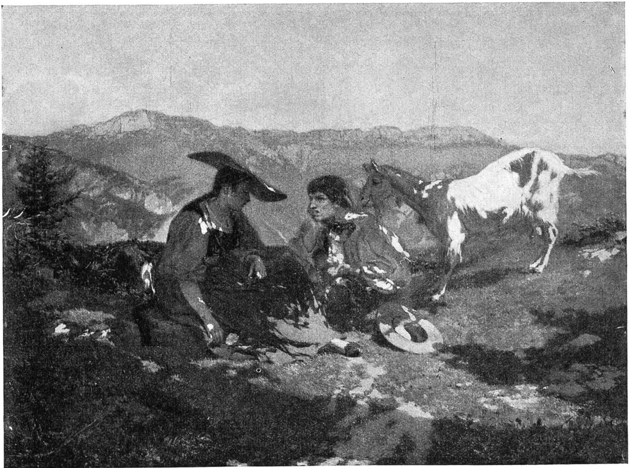
Frank Buchser: Ziegenhirten im Jura.