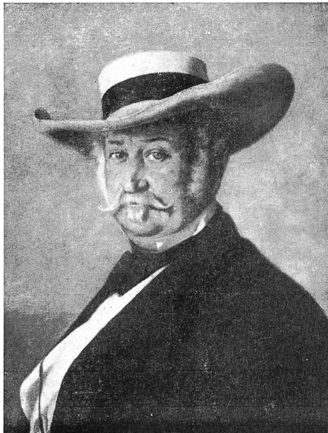
Frank Buchser: General Sutter.

Freunde antraf, setzte auch wieder nach Tanger über und kam 1880, mit Bildern reich beladen, heim. Auf einen Aufenthalt in Rom, Clevano und Carpinete (1881) folgen drei Studienreisen nach Griechenland von 1882—1884, die ihn nach Korfu, Patras, Athen, Marathon und auf der Rückreise nach Albanien, Montenegro und Ragusa brachten. 1884, 1885 und 1888 fanden seine letzten italienischen Reisen statt.