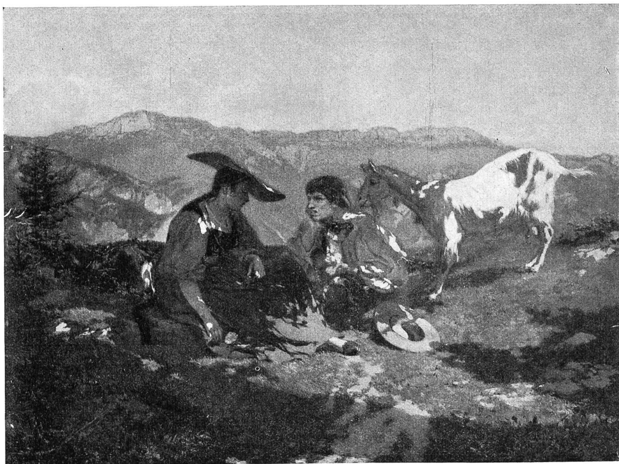
Frank Buchser: Ziegenhirten im Jura.

Hier hatte sich mittlerweile sein Verwandter Schnetz niedergelassen, der ihn jetzt liebevoll aufnahm und ihm seine Arbeiten korrigierte. In der zweiten Hälfte des Jahres 1851 begab er sich dann zum Studium nach Antwerpen und Brüssel, wo er fleissig van Dyck, Rembrandt, Rubens und Jordaens kopierte. Dort ist wohl auch seine erste 1851 datierte Radierung entstanden, die einen am Boden sitzenden halbnackten Bettler darstellt. Als er im Frühjahr 1852 nach Paris zurückkehrte, war Schnetz mit seinen Fortschritten