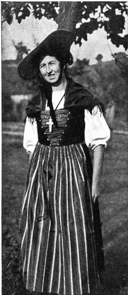
Die Schwarzbubentracht gefällt überall!