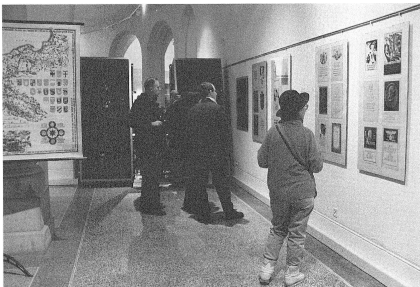
Abb. 12. Besucher in der Sonderausstellung «1.9.39. Ein Versuch über den Umgang mit Erinnerungen an den Zweiten Weltkrieg». (S. 20)

gen von Iwan E. Hugentobler. Die Ausstellung wurde vor allem von Veteranen des Aktivdienstes beachtet und besucht.