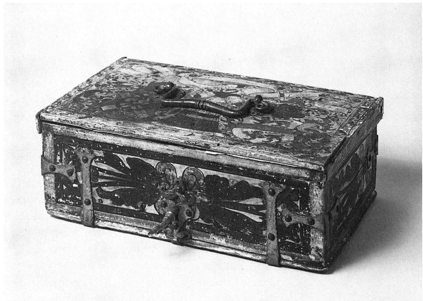
Abb. 13. Minnekästchen. Buchenholz und Eisen, auf Deckel bemalt mit Familienwappen der de Mestral Combremont. Datiert 1544. Länge 28 cm. (S. 48, 64)

Mit 23 635 Besuchern, einer stattlichen Zahl, bewegen wir uns im Mittel der vergangenen Jahre.