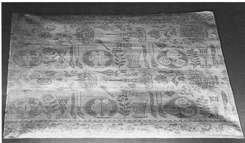
Abb. 14. Leinendamastserviette. Motiv des gedeckten Tisches. Um 1700. (S. 51, 66)