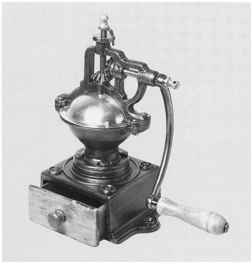
Abb. 29. Kaffeemühle. Gusseisen. Fabrikat «A und O». Ende 19. Jh. Höhe 29,5 cm. (S. 58)

Der zweite Teil umfasst die wissenschaftlichen Fachgebiete. Aufgeteilt in