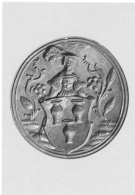
Abb. 31. Gebäckmodel mit Wappen Murer. Holz. Zürich. Datiert 1642. Höhe 19,2 cm. (S. 41, 60)