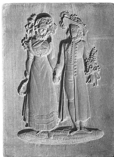
Abb. 33. Gebäckmodell. Ländliches Brautpaar. Holz. 1810/20. 16 x 11,5 cm. (S.41, 60)