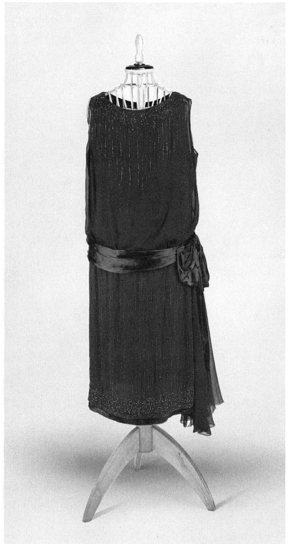
Abb. 62. Abendkleid. Schwarzer Seiden- organza und metallisierte Glasperlen. Um 1925. Rückenlänge 105 cm. (S. 23 und 35)

kleine Raum, welcher der künftigen Zweigstelle im Welschland gewidmet ist, neu eingerichtet worden: Es werden dort nun einzelne, für Schloss Prangins bestimmte Objekte ausgestellt, von denen einige vor kurzem restauriert worden sind. Der Besucher gewinnt dadurch einen Einblick in die verschiedenen Etappen einer Ausstellungsvorbereitung.