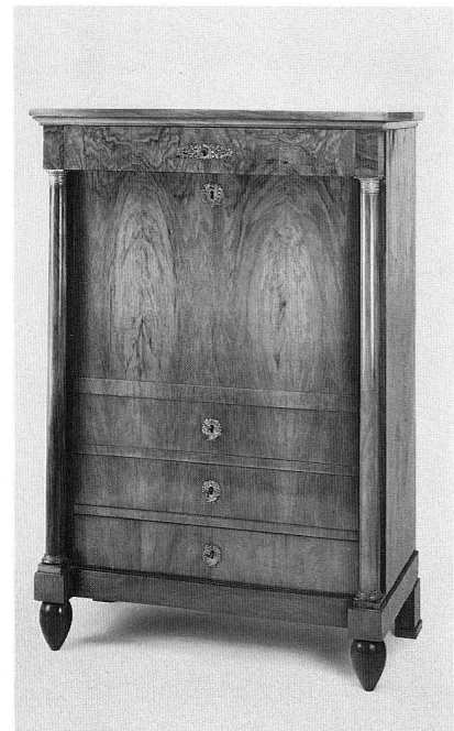
Abb. 59 und 60. Sekretär. Nussbaum- und Kirschbaumholz. Von Martin Hirschgartner, Zürich. Um 1820. Höhe 144 cm. (S. 20 und 36)

Im Hauptgebäude des Schweizerischen Landesmuseums in Zürich ist der