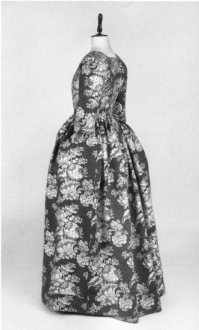
Abb. 61. Damenkostüm. Seitenansicht. Weiss- auberginefarbener Seidendamast. Zürich. Um 1780/90. Rückenlänge 145 cm. (S. 22, 34 und 42)