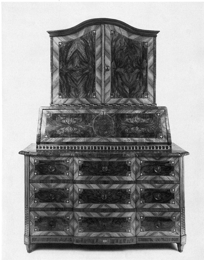
Abb. 58. Aufsatzschreibkommode. Nussbaum-, Ahorn-, Eben-, und Eibenholz. Um 1780. Höhe 210 cm. (S. 20 und 36)

Die ersten sechs Monate des Jahres 1988 sind dazu benützt worden, die Entscheide des Bundesrates in die Tat umzusetzen, d. h. eine auf dem revi-