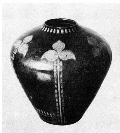
66. Vase, glasierte Irdenware mit buntem Engobedekor. Arbeit der Kunsttöpferei Albert Wächter, Heimberg-Zürich. 1907- um 1920. (S. 31 und 61)

Parmi les publications qui ont paru cette année, il nous faut mentionner tout spécialement le livre illustré «Patrimoine culturel de la Suisse». Ses nombreuses illustrations avec textes succints donnent une image arrondie des trésors de notre musée. Grâce à l'aide financière de la Société pour le Musée national suisse qui s'est chargée des frais de traduction, cette oeuvre fait de la publicité pour nos collections en langues allemande, française, italienne et anglaise. Le «Guide du Musée du Vieux-Zurich, une demeure du XVIII e siècle» a été traduit en français et en anglais. La série des publications scientifiques du Musée national suisse a été agrandie par les catalogues suivants: «Waffen im Schweizerischen Landesmuseum, Griffwaffen I» (armes au Musée national suisse, armes blanches I) et «Wandgemälde von Münstair bis Hodler» (peintures murales de Münstair jusqu'à Hodler). L'ouvrage «Bewaffnung und Ausrüstung der Schweizer Armee seit 1817» (armement et équipement de l'armée suisse à partir de 1817) dont l'édition entière comprendra 14 volumes a été complété du tome 8 «Artillerie I, Geschütze der Artillerie ohne mechanischen Rohrrücklauf» (artillerie I, pièces d'artillerie sans recul du ca-