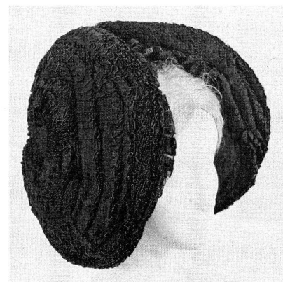
68. Rosenkappe. Aus schwarzen, aneinandergereichten Seidenbandrüschen. Um 1700. Gesichtsbogen 2 x 35 cm. (S. 32 und 61)