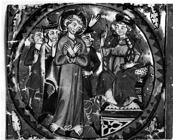
14. Christus vor dem Hohenpriester. Miniaturenfragment der Initiale I aus dem Graduale von St. Katharinen- thal/TG, um 1312. 6,2 x 7,6 cm (S. 24 und 59)