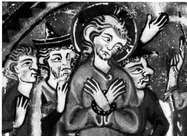
15. Ausschnitt aus Abb. 14

lohnt hat, zeigt der vermehrte Besuch, erreichten wir doch damit die stolze Zahl von 60 000.