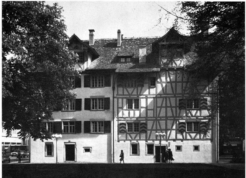
8. Wohnmuseum Bärengasse 20/22, Nordfassade, Ende 17. Jh. (S. 13 ff.)

besprochen war, fehlten immer noch die entsprechenden schriftlich fixierten Abmachungen zwischen den verschiedenen Beteiligten. Diese wurden nun im Berichtsjahr endgültig bereinigt, in gesetzlich einwandfreie Formen gebracht und von den Parteien unterzeichnet. Vorerst übergab der Schweizerische Bankverein dem Stadtrat zuhanden einer zu gründenden Stiftung den versprochenen Beitrag von einer Million Franken nebst Zinsen, vom Tage der Volksabstimmung über die Verschiebung der beiden Häuser an gerechnet. Diese Schenkung sollte zur Deckung der Kosten für den Betrieb des Wohnmuseums und für die Einrichtung als Museum dienen, soweit letztere den vom Volk bewilligten Kredit für die Renovation der Bärengasse-Häuser überschreiten würde.