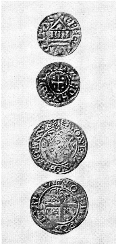
16. Oben: Denar des Bischofs Konrad von Genf, um 1000, Silber Unten: Batzen von Schwyz, 1571, Billon. Nat. Größe (S. 22 f. und 63)

Kontakt mit sämtlichen Konservatoren gab ihm Einblick in alle Abteilungen und Tätigkeiten auch hinter den Kulissen.