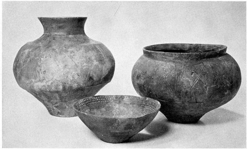
6. Gefäße mit teilweise reicher Ritzornamentik, aus der Nekropole auf dem Homberg bei Kloten ZH. Grabung Kantonale Denkmalpflege Zürich 1962. Größtes Gefäß Höhe 27,5 cm (S. 60)

wir auch für Sekundar- und Mittelschulen vermehrt Führungen. Bei der Betreuung von Absolventen der Städtischen Berufsschule (früher Gewerbeschule) wurden für unser Haus neue Wege beschritten, indem in zwei Klassen eine Anzahl Schüler nach eingehender Beschäftigung mit je einem Thema ihre Kameraden selbständig durch ausgewählte Teile der Schausammlung führten. Dabei standen Themen aus Geschichte von Handwerk und Technik, Konservierungs- und Restaurierungskunde und Kopiertechnik im Vordergrund, um den jungen Leuten, denen ein Besuch in einem kulturgeschichtlichen Museum eher fern liegt, den Zugang zu erleichtern. Das Experiment fand außerordentlich guten Anklang und soll wiederholt werden. Die Beziehungen zu den verschiedenen Lehrerseminarien in und um Zürich wurden intensiv gepflegt. Besonders die Fachlehrer für Didaktik des Geschichtsunterrichtes am Kantonalen Oberseminar Zürich stellen Museumsbesuche immer wieder in den Mittelpunkt ihrer Darlegungen. Wir erleichtern und fördern denn auch tatkräftig dieses für uns wichtige Unterfangen. Unterstützt vom Schuldienst des Museums, verfaßten Absolventen des Evangelischen Seminars Untersträß Arbeitsblätter für den Unterricht im Museum.