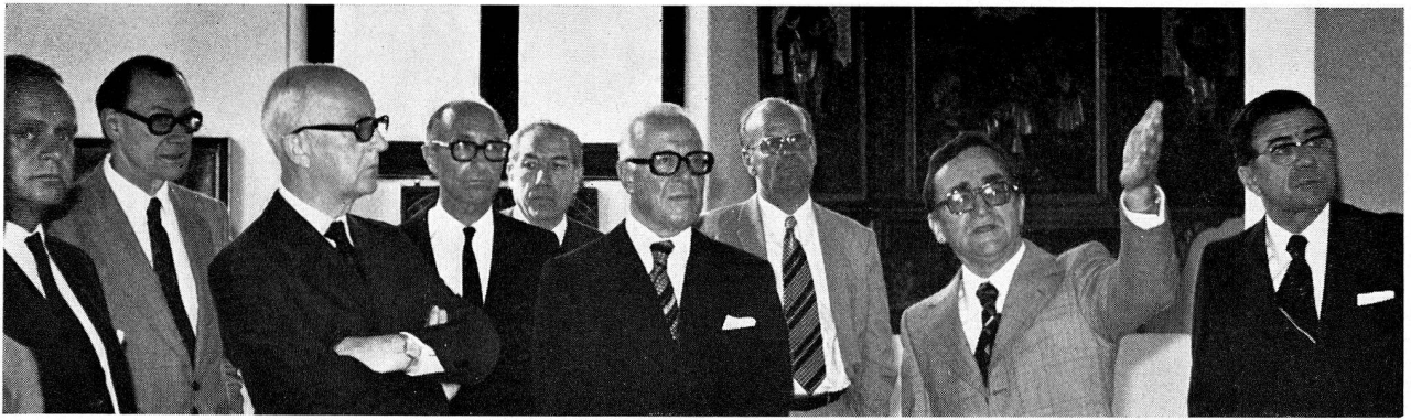
7. Bundesrat Pierre Graber in Begleitung schweizerischer Botschafter anlässlich einer Führung im Landesmuseum (S. 15)

betreute der Führungsdienst in vielfältiger Weise eine Reihe von in- und ausländischen Gästen, zum Teil in Zusammenarbeit mit der Stiftung Pro Helvetia.