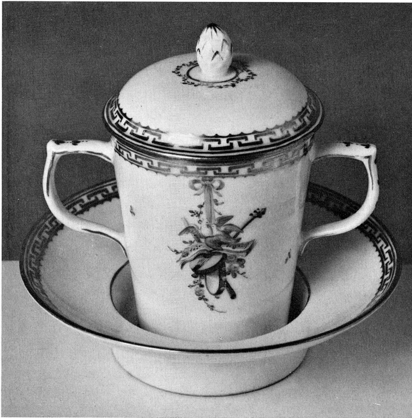
36. Trembleuse aus Nyonporzellan, um 1785. Höhe 13,2 cm (S. 22 und 66)

für die wissenschaftliche Forschung lebensnotwendige Auswertung der Fachzeitschriften. Dem Hauptziel unserer Bibliothek als Arbeitsinstrument des wissenschaftlichen Stabes entsprechend war die Ausleihe außer Haus wieder gering. 415 Bücher, Broschüren und Zeitschriftenbände verließen für kurze Zeit das Museum, davon rund 33 % über den interbibliothekarischen Leihverkehr in die ganze Schweiz. Erfreulich ist dabei die Tatsache, daß etwa ein Drittel der so ausgeliehenen Bücher aus der Romandie verlangt wurde. Drei Universitätsstädte der französischsprachigen Schweiz figurieren denn auch unter den fünf Städten, aus denen unsere Bibliothek die meisten Anfragen erhielt: Bern 20 %, Basel 19 %, Neuenburg 16 %, Genf 9 %, Lausanne 7 %. Die Hauptsammelgebiete und damit die Bedeutung der Museumsbibliothek werden durch die Ausleihstatistik klar dargelegt: 51 % der ausgeliehenen Bücher betreffen die Ur- und Frühgeschichte, 14 % die Kunstgeschichte und 9 % die Numismatik, wobei hier der Hauptteil auf die der Zentralbibliothek gehörende, aber im Museum als Depot gelagerte Literatur entfällt. Bei den Zeitschriften liegt das Schwergewicht noch eindeutiger bei der Ur- und Frühgeschichte: 68 % der ausgeliehenen Bände gehören zu diesem Fachgebiet, weitere 12 % zur Kunstgeschichte, während alle übrigen Sachgebiete unter 6 % blieben.