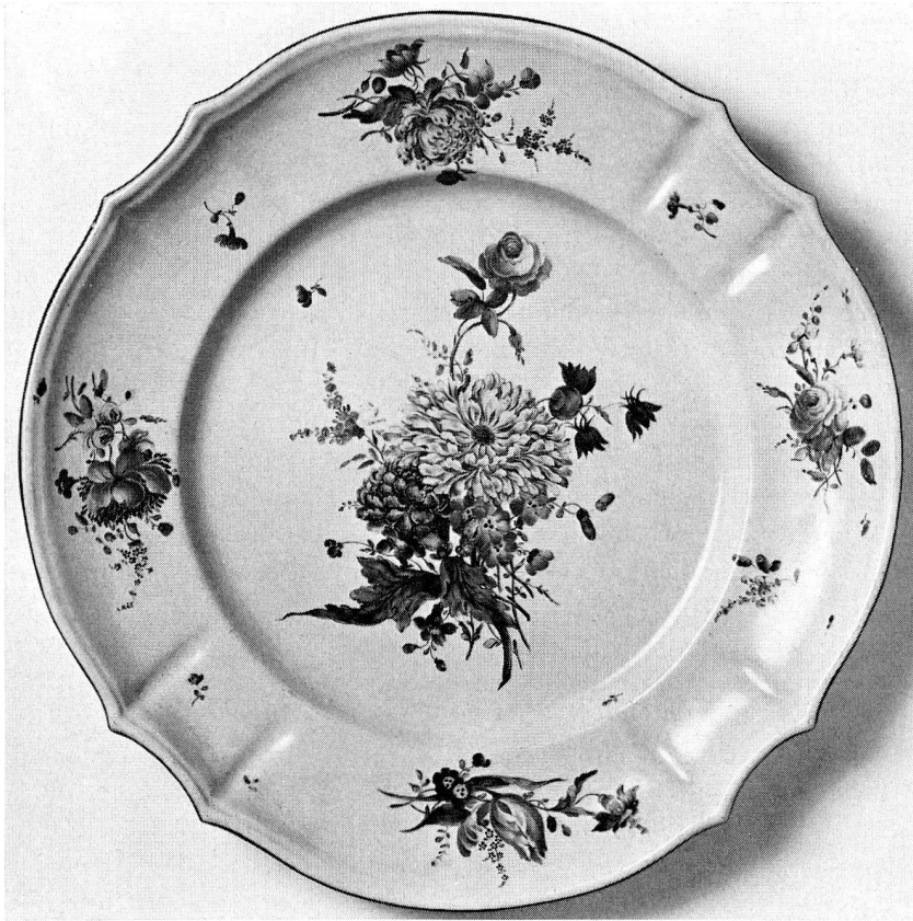
27. Platte aus Berner Fayence, mit buntem Blumendekor. Um 1765. Durchmesser 36 cm (S. 61)