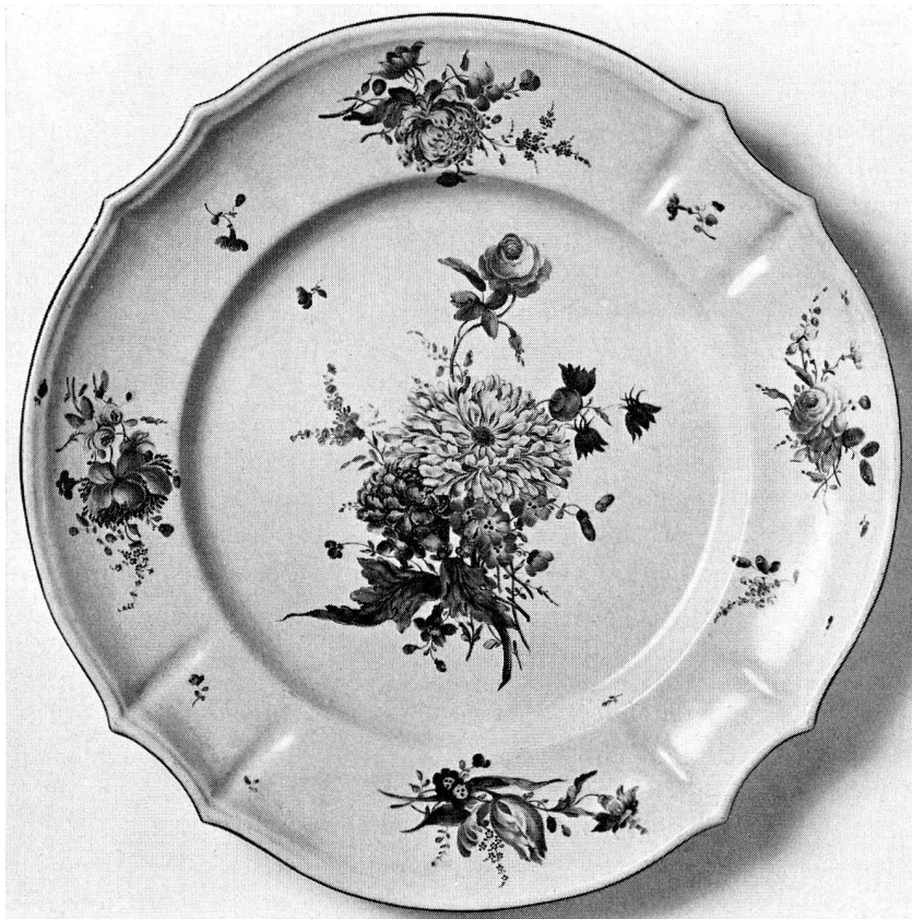
27. Platte aus Berner Fayence, mit buntem Blumendekor. Um 1765. Durchmesser 36 cm (S. 61)