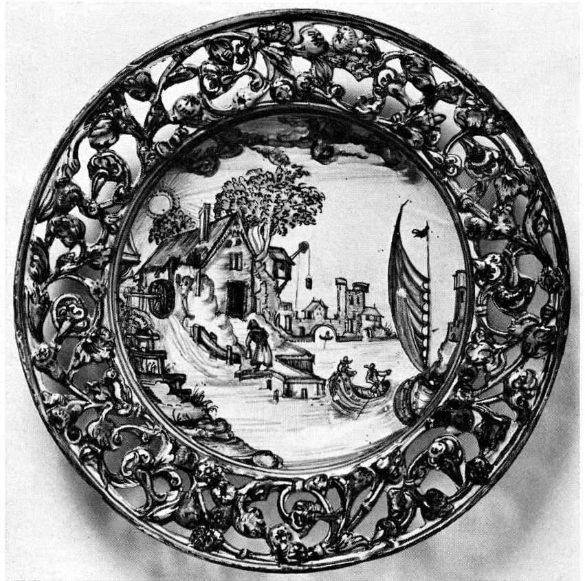
26. Fayenceteller mit durchbrochenem Rand und Landschaftsdekor. Winterthur (Kt. Zürich). Um 1630/40. Durchmesser 35,5 cm (S. 27, 58)

(Brunnen- und Gartenfiguren, Brunnentröge, Grabsteine, Epitaphien, Werkstücke mit heraldischem oder epigraphischem Schmuck usw.) so gelagert, daß jedes Objekt leichter gefunden und betrachtet werden kann. Die durchgehende Palettierung der meist sehr schweren Materialien erlaubt, diese müheloser zu bewegen. Die kleineren Steinplastiken und die Gipsabgüsse befinden sich in mobilen und raumsparenden Gestellanlagen. Die Beschriftung und Anlage der nötigen Inventarverzeichnisse der Bestände wird Aufgabe der nächsten Jahre sein.