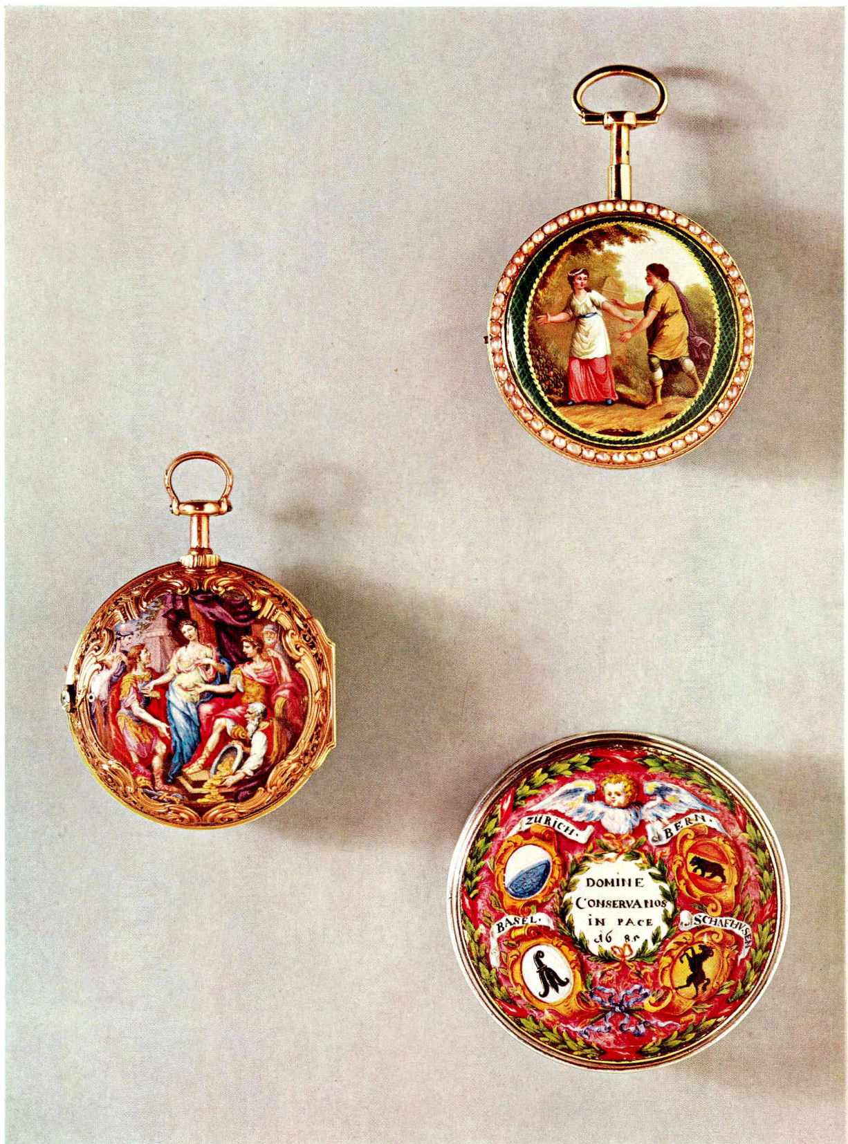
Oben rechts: Goldene Taschenuhr mit Emailmalerei. Arbeit von Guidon, Remond Gide et Cie, Genf, um 1810. Durchmesser 4,9 cm (S. 68)