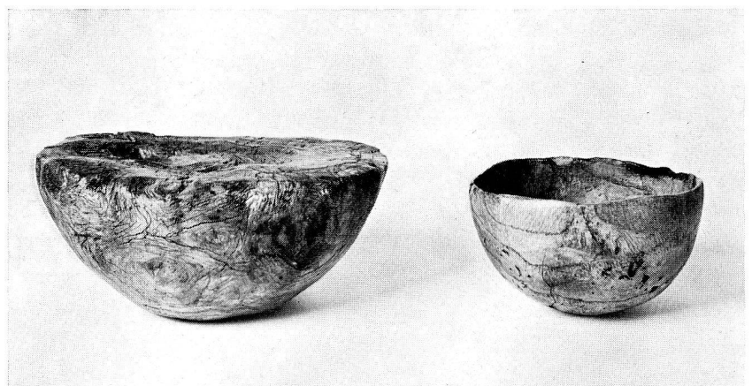
1. Halbfabrikat einer Schale aus Maserknollen und Fertigprodukt einer solchen aus der jungsteinzeitlichen Siedlung Egolzwil 2, Wauwilermoos (Kt. Luzern). Ca. 1/3 nat. Gr. Eigentum des Naturhistorischen Museums in Luzern (S. 22)

Der Kommission oblag auch die Genehmigung der Voranschläge des